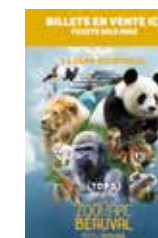
Affiche Billetterie 40 x 60 cm