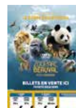
Affiche Billetterie A3