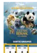
Affiche Groupe A3