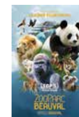
Affiche 40 x 60 cm