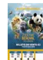
Affiche Billetterie A4