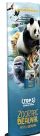
Totem Étudié pour contenir 1 paquet de 100 dépliants 63 x 190 cm