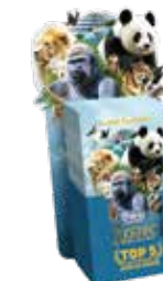
Présentoir Étudié pour contenir 1 paquet de 100 dépliants 20 x 41 cm