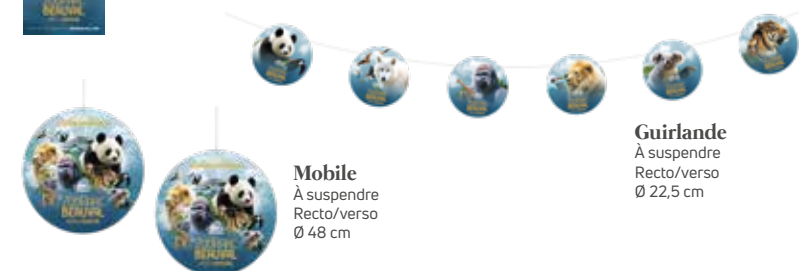
Guirlande À suspendre Recto/verso Ø 22,5 cm