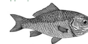
Dorade (Cyprinus auratus).