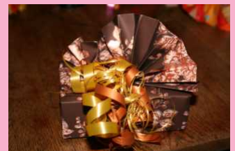
Foto's workshop inpakken d.d. 8 april 2008