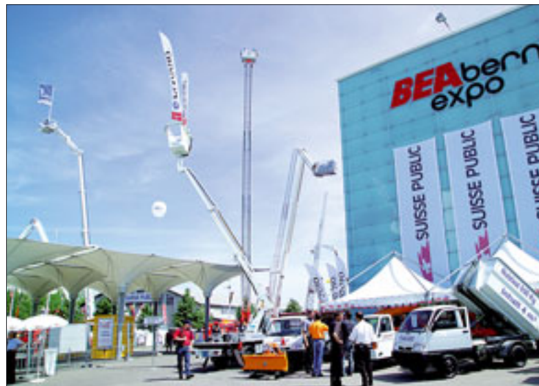
Gern nach Bern – wegen dieses Panoramas