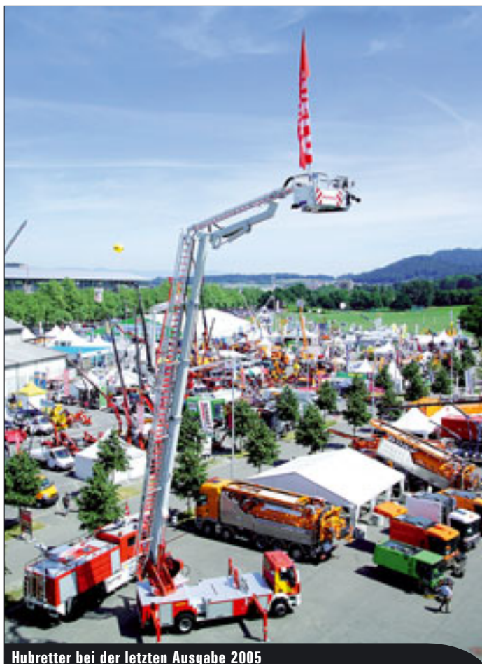
Hubretter bei der letzten Ausgabe 2005

Public statt. Ihr Alleinstellungsmerkmal: Sie ist die einzige schweizweite Fachmesse für öffentliche Betriebe und Verwaltungen. Einkäufer, Sachbearbeiter, Fachkommissionen und Behörden können sich auf der Messe einen aktuellen Marktüberblick verschaffen, wertvolle Entscheidungshilfen und beste Vergleichsmöglichkeiten finden. Darüber hinaus sei die Veranstaltung zum Treffpunkt der Stadt- und Gemeindevertreter avanciert, so die Veranstalter, aber auch