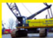
Sennebogen 670 R