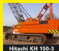
Hitachi KH 150-3