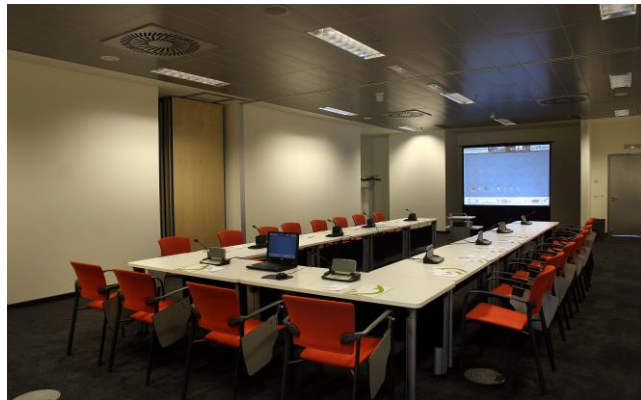
Sala formato "U" (capacidad max 24 pax)