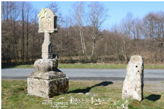
Peyrelevade : la Croix du mouton

Organisation : USSEL-Cyclotouristes des Monédières