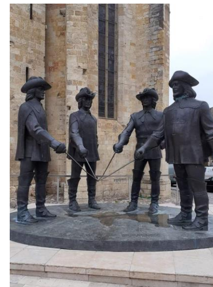
CONDOM dans le Gers : statues des mousquetaires gascons

6 circuits : total 892 km – Dénivelé: 10586 m