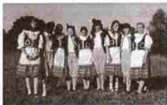
Na fotografii naše skautky připraveny k vystoupení České besedy.

Exchange Prague-Salisbury (Anglie) Praha