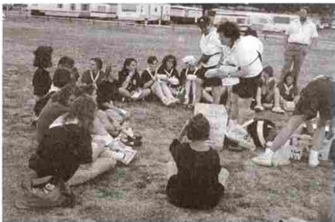
Piknik s anglickými sestrami

Po rozloučení s rodinami jsme odjeli do vzdálenějšího městečka Pueulemoutière,