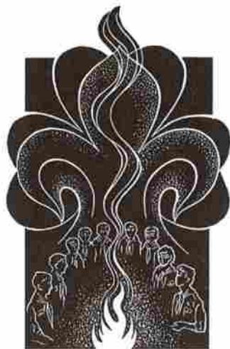
Linoryt: Ladislav Rusek - Šaman

setkáních v mnoha místech, že děti 90. let jsou v podstatě stejné jako generace předcházející. Liší se mnohem více ve vnější formě chování než ve skutečných postojích. Základní vývojové charakteristiky platí dnes jako včera: touha po dobrodružství, po lepším životě, po kladných vzorech, po aktivitě, přá-