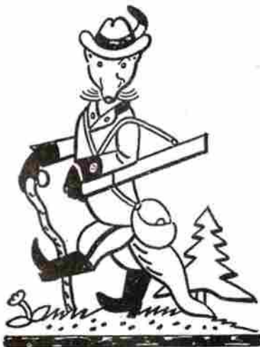
Potkáte-li v lese příliš krotkou lišku, vyhněte se jí obloukem. Mohla by mít vzteklinu.

Nemocný pes má charakteristický vysoký štěkot, pokleslou dolní čelist (vypékají mu sliny), široké zornice a nápadně pije. Další nápadností je hltavá žravost nestrávitelných věcí – žere slámu, seno, dřevo. Zvířata jsou zprvu apatická, ale brzy se stávají neklidnými, tékavými, podezřívavými. Chňapají a útočí na vše, co se pohybuje. Již před vypuknutím nemoci mají ve slinách virus a jsou schopna nakazit.