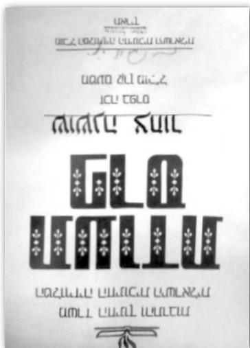
Ocenění za pořad pro děti „Parpar Nechmad“ (O roztomilém motýlku).

Zcela po právu obdržela Shoshana za tuhle zásluhou a náročnou práci řadu izraelských i mezinárodních ocenění.