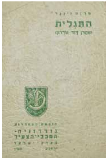
עבוד סיפורית של מפגש עם המנהיג הציוני א.ד. גורדון

הצליחה להגשים דוקא כאן בארץ ישראל. כל מי שהיה בדגניה א' וודאי יסכים אתי שמדובר במקום נהדר, מלא השראה - ואירמה זינגר, כאן בשדה התחדשות התרבות היהודית, ביצעה עבודה שלא תאמן.