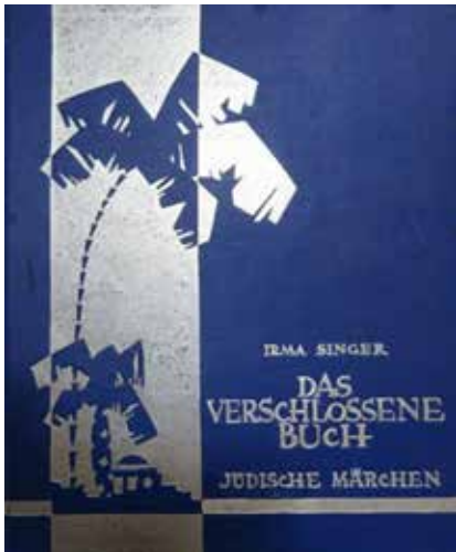
עבודת הבכורה של אירמה זינגר, יצאה לאור בשנת 1918

ספרות, סיפורים אלו לא היו משהו חריג אך צורת ההגשה נראתה לו: בכל ספרי הילדים שלה, אירמה זינגר (אפילו בראשון) השתדלה לחזק את זהותם היהודית של הילדים ולהציע להם את חזון החיים בארץ ישראל – בהשוואה לחיים באירופה, שם היהודים תמיד היו זרים. הספר תורגם אחר כך לפולנית 7 ולצרפתית ואירמה הפכה פתאום לכוכב ספרותי.