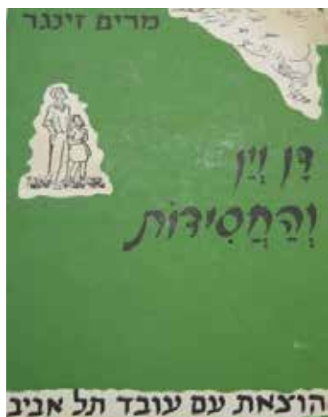
בפרסום "דן, יאן והחסידות" המחברת - בצורה מתאימה לקורא הצעיר - מתעמתת עם השואה