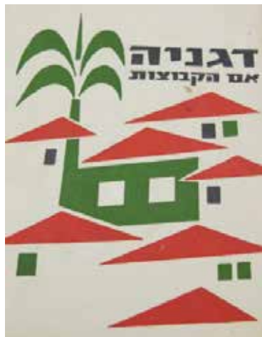
"דגניה אם הקיבוצים" פרסום על התחלות התנועה הקיבוצית

אחרי בואה לדגניה א' אירמה עבדה בעבודות שונות ואחרי זמן מה ניצלה את הכשרתה כגננת. בתחילה לא הייתה לה כאן עמדה קלה; רבים