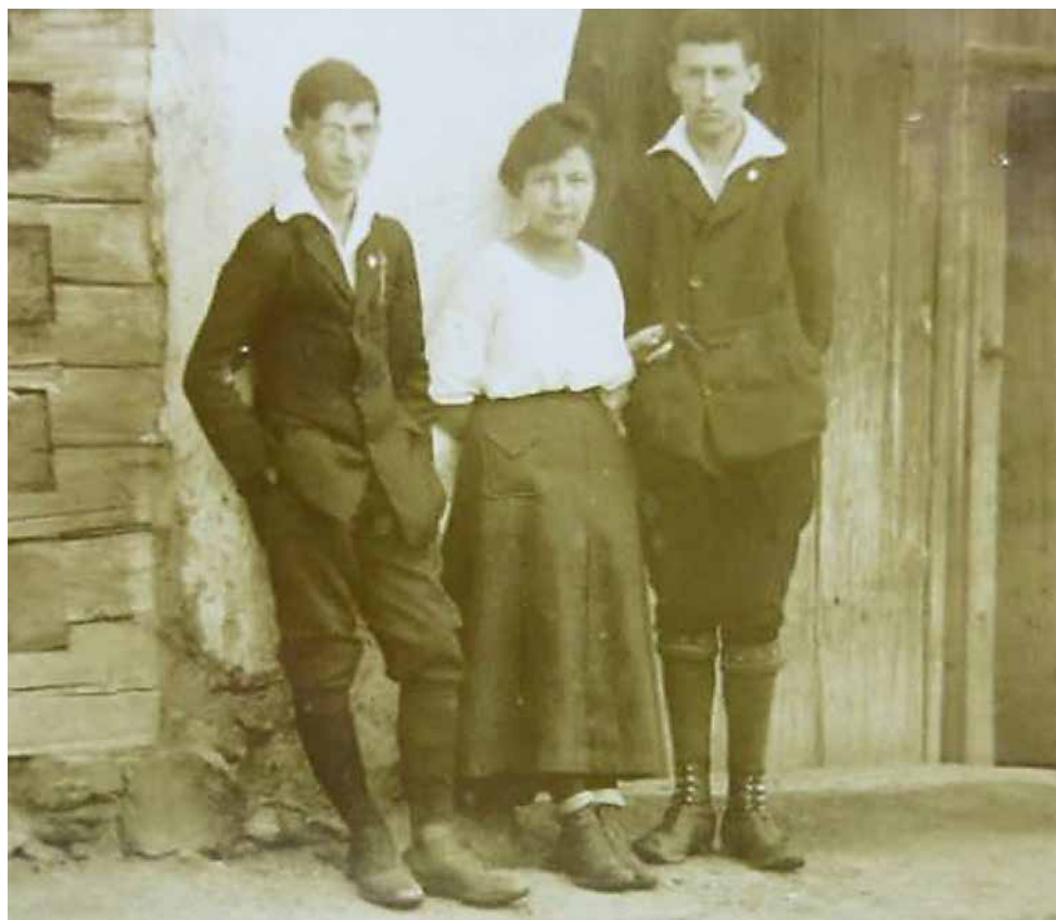
פרנץ קפקה, אירמה זינגר, בלתי ידוע