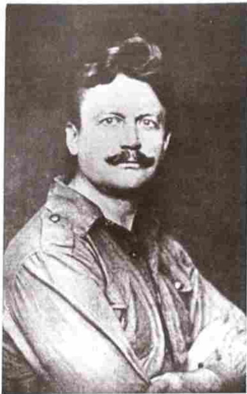
Oficiální fotografie br. náčelníka z roku 1920

Zní to snad tvrdě, ale je to pravda, že nevím z vlastní zkušenosti, co je to mltí otce, a že jsem ho dokonce nikdy ani nepostrádal. Ovšem jen zásluhou matky.