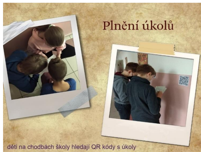
děti na chodbách školy hledají QR kódy s úkoly