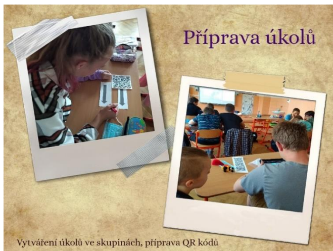
Vytváření úkolů ve skupinách, příprava QR kódů