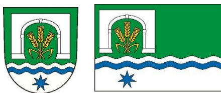
Figura trojice zkřížených obilných klasů s listy v bráně do dvora podtrhuje historicky zemědělský ráz Radčic. Stylizovaná brána do dvora připomíná historickou selskou zástavbu, která je pro Radčice typická, a která generovala vznik vesnické památkové zóny v Radčicích.

Figura hvězdy je volně inspirována prvním polem čtvrceného znaku kláštera Plasy, v jehož majetku se ves uvádí ve 14. a 15. století. Současně je hvězda jedním z atributů Panny Marie a připomíná tak kapličku na návsi. Ve znaku Plaského kláštera je hvězda šestihrotá, ovšem v návrhu znaku a vlajky městského obvodu Plzeň 7 - Radčice je hvězda modifikována do podoby sedmihroté hvězdy, když počet 7 hrotů koresponduje s číselným označením městského obvodu „Plzeň 7“.