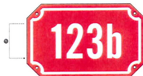
Cedulka bez doplňkového textu