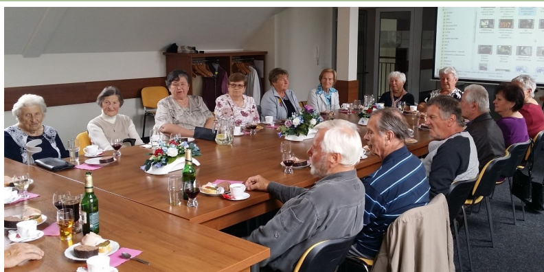
obce. Při odchodu byly všem přítomným předány dárky, které připravila kulturní a sociální komise.

Závěrem jako vždy byly promítány krátké reportáže z