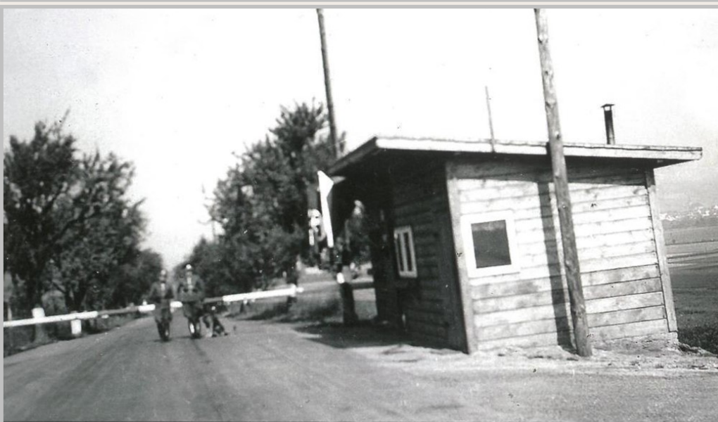
Hraniční závora u Kozolup