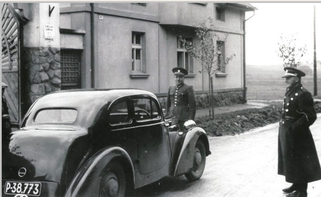
Celní kontrola na konci Křimic.