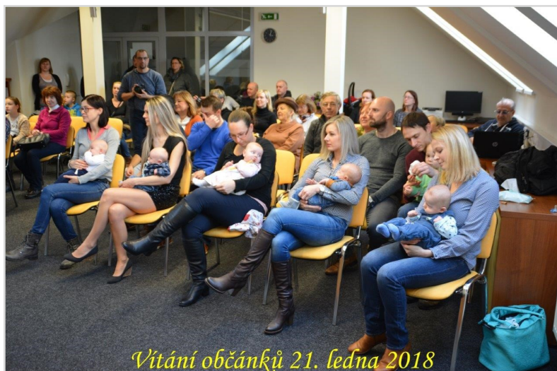
Vítání občánků 21. ledna 2018