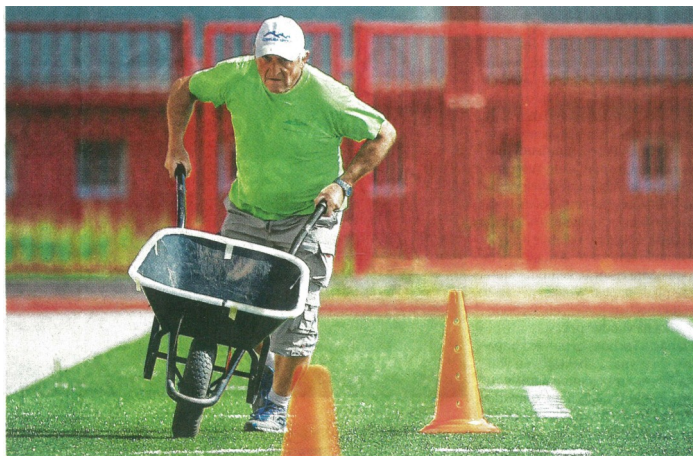
Náročná disciplína. Jedna z disciplín seniorských her, které se uskutečnily v Plzni.

Blahopřejeme a děkujeme za vzornou reprezentaci Křimic!