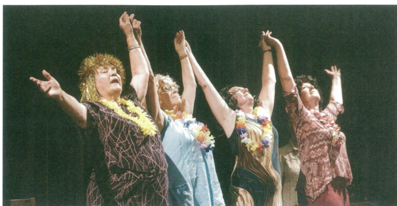
Senioři bavili seniory.