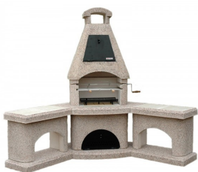
Obrázky pro ilustraci