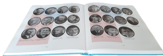
Vydání knihy Ves u zámku v roce 2019