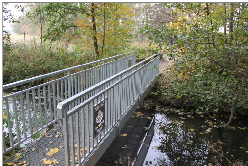
Lávka přes Vochovský potok na Bobří stezce z roku 2020