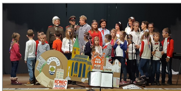
↑ Oslava 30 let od sametové revoluce → Desinfekce veřejných prostor v březnu 2021