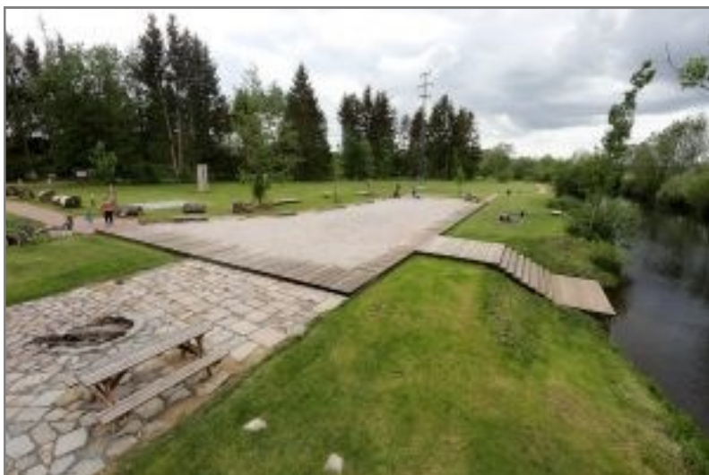
Dokončení Křimické pláže v roce 2019