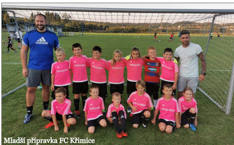
Mladší přípravka FC Křimice

Podzimní část soutěží by měla být odehrána do konce října. Poté bude následovat zimní přestávka. Pokud budete mít chuť a čas, přijďte fandit nejen na domácí zápasy. Odkaz na soutěže a výsledky naleznete na našich webových stránkách www.fckrimice.cz . Radost nám dělají i naši nejmenší. Ti každý týden hrají turnaje a několikrát týdně poctivě trénují. Zde musíme poděkovat všem rodičům za neúnavnou podporu, zavazování tkaniček a motivaci :-)