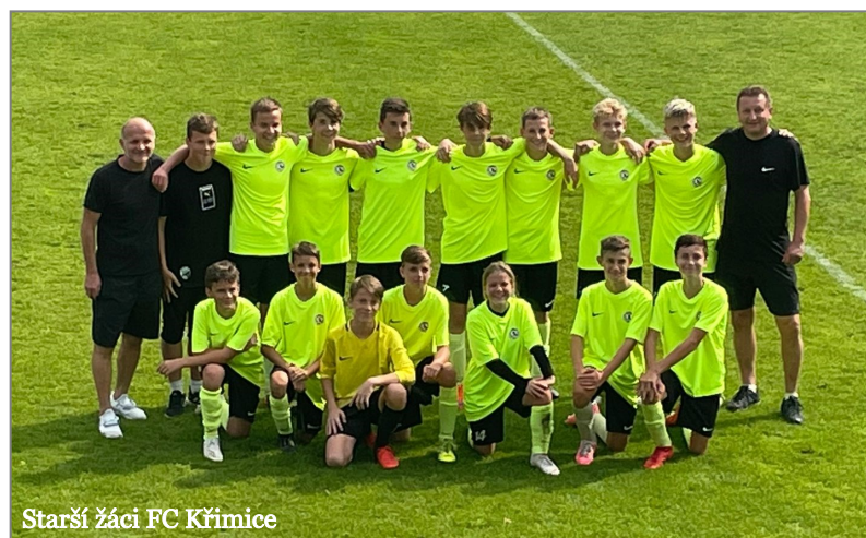
Starší žáci FC Křimice