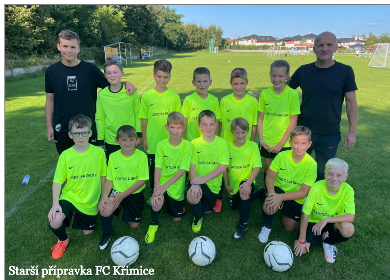
Starší přípravka FC Křimice