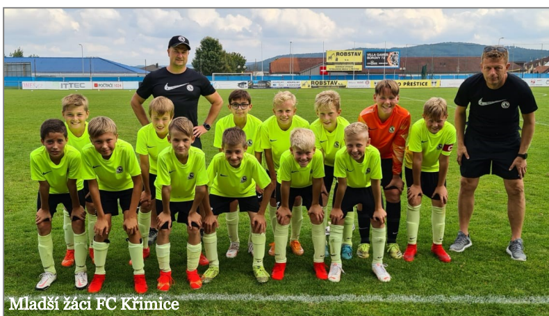
Mladší žáci FC Křimice

FC KŘIMICE po dvou letech uspěl s žádostí u města Plzně o dotaci a začal se stavbou osvětlené tréninkové plochy s umělým povrchem. Do této velké investice vložil klub větší polovinu z vlastních zdrojů a všichni doufáme, že tímto projektem zvýšíme kvalitu tréninků zejména v klimaticky méně příznivých měsících.