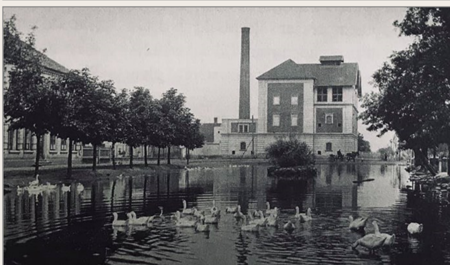
Rybník před obecní školou a krásný Lobkowiczský pivovar s pivem Králův zdroj.