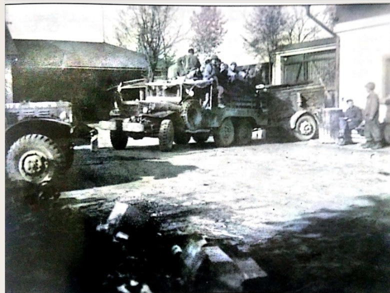
Na dvoře ve statku U Ženíšků