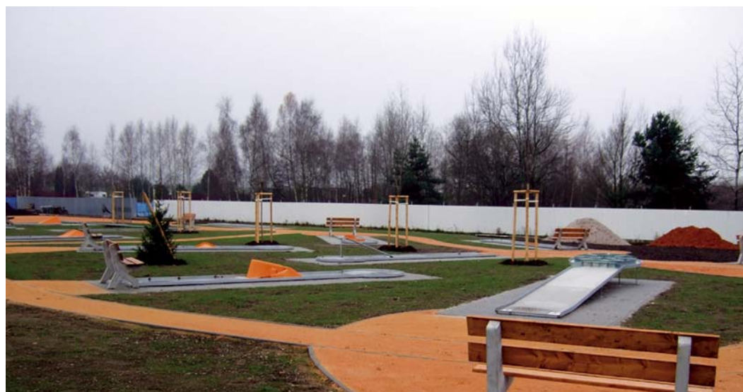
V areálu vzniklo i nové hřiště na minigolf. Hrací dráhy odpovídají požadavkům nejvyšších soutěží

Jezírko v areálu na Borech bude jedinečné v tom, že bude mít vodu speciálně upravenou – bez chloru a dalších chemií, takže bude vhodná ke koupání i pro malé děti nebo alergiky. Úprava spočívá v několikanásobné biologické filtraci a použití UV lamp. Tím budou mít návštěvníci zaručenou vynikající kvalitu vody s ideálními vlastnostmi k vodním radovánkám po celou sezónu.