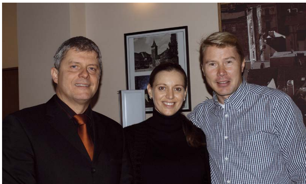
Starosta Jiří Strobach uvítal na úřadě vzácnou návštěvu. Legendární jezdec Formule 1 Mika Häkkinen přišel na úřad s přítelkyní Markétou Kromatovou zapsat svoji dceru Ellu na matriku.