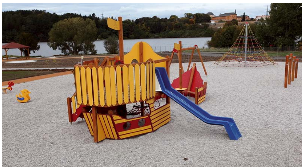
Dětské hřiště v nově vybudovaném areálu je už kompletní. Děti se mohou těšit na celou řadu prolézaček, houpaček i skluzavek

cializovanou asistenci a nám se v loňském roce nepodařilo zajistit provozovatele, který by se o tyto prvky staral. Navíc mají možnost občané Plzně v tuto chvíli podobné prvky využívat na Slovanech ve Škoda sport parku. Pokud by návštěvníci našeho areálu projevíli velký zájem o dobudování těchto dvou nebo