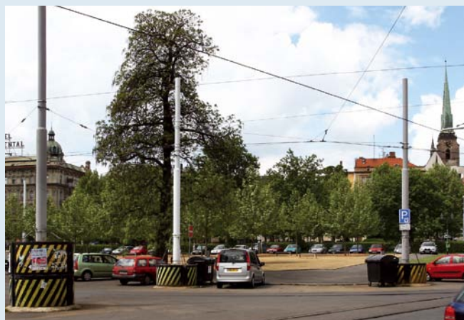
Povodně v roce 2002 narušily statiku domu, a proto byl odstřelen.