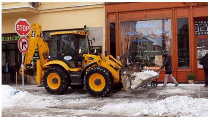
MO Plzeň 3 má na starosti celkem 840 tisíc m 2 komunikací pro pěší a 970 tisíc m 2 pozemních komunikací. Do kompetence obvodu patří také úklid zastávek městské hromadné dopravy.

V centru města je vůbec největší problém s odklizením sněhu, jelikož těžká technika nemůže vjet na náměstí Republiky. Rovněž ruční odklizení sněhu je tu velmi složité, hrany porfyrové dlažby brání manipulaci s hrably a lopatami. Při sněhové kalamitě obvod posílal do ulic maximální počet pracovníků i osob pobírajících sociální dávky. To ale nestačilo a proto v ulicích pomáhali i strážníci. „Vzhledem ke kalamitní situaci a nutnosti okamžitého řešení jsme se obrátili