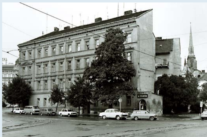
Dům U Zvonu, ve kterém měl svoji dílnu vynálezce obloukové lampy František Křižík.