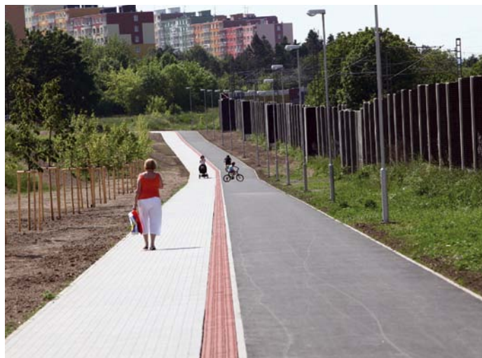
Jedna z dokončených investičních akcí 2010 byla nová in-line dráha ve Skvrňanech.

Připravují se cyklostezky v Domažlické, Vejprnické a Borské ulici. Obvod plánuje výstavbu nových hřišť v areálu hasičské zbrojnice ve Skvrňanech a také ve vnitrobloku v Plachého ulici.