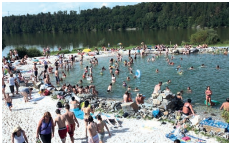
Koupací jezírko je v létě za slunečného počasí hojně využíváno