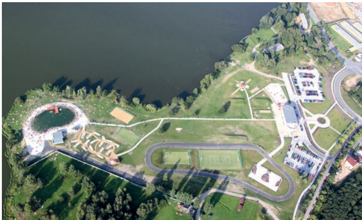
Letecký pohled na areál Škodaland u přehrady České údolí

Areál Škodaland právě rozjel čtvrtou sezónu. Otevřeno je nyní po celý den od 8 do 22 hodin. A tak to bude až do konce září. Od října potom začíná ve Škodalandu vedlejší zimní sezóna a otevřeno je od 10 do 16 hodin. Areál se od svého otevření dočkal řady vylepšení, atrakce neustále přibývají a prostor se vylepšuje. „Chystáme pro letní sezónu novinku, a to