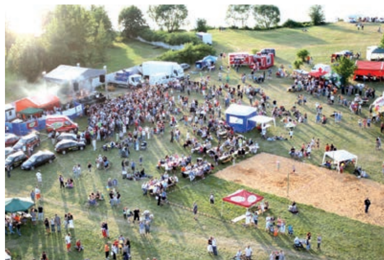
První tři ročníky Balonové show se konaly ještě na zelené louce

měsících jsou využívány šlapadla a lodičky. Projížďka po přehradě České údolí je při slunečném počasí parádním odpočinkem. Při vysokých teplotách nejvíce láká koupací jezírko.