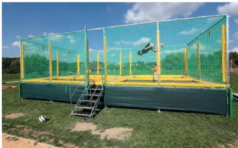
Čtyřmodulová profi trampolína přibyla v areálu v loňském roce

show s bohatým programem. „První tři ročníky Balonové show proběhly v tomto prostoru dokonce v době, kdy žádný areál nestál a byla tu jen zelená louka se starým tobogánem. Letos se koná 21. června už sedmý ročník,“ upřesnil starosta Jiří Strobach. Každoročně se ve Škodalandu můžete těšit i na největší