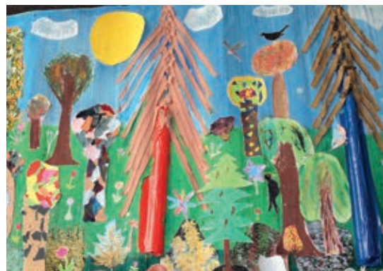
Koláž z šatních látek a zipů vyrobili páťáci z 11. MŠ