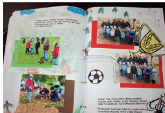
Zvláštní cenu si zasloužily děti z 27. MŠ za krásnou knížku

Všechny soutěžní práce budou vystaveny na Balonové show 21. června ve Škodalandu.