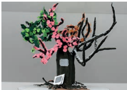
Vítězné dílo „Stoletý Čtyřdobák borský“ od dětí ze 44. MŠ