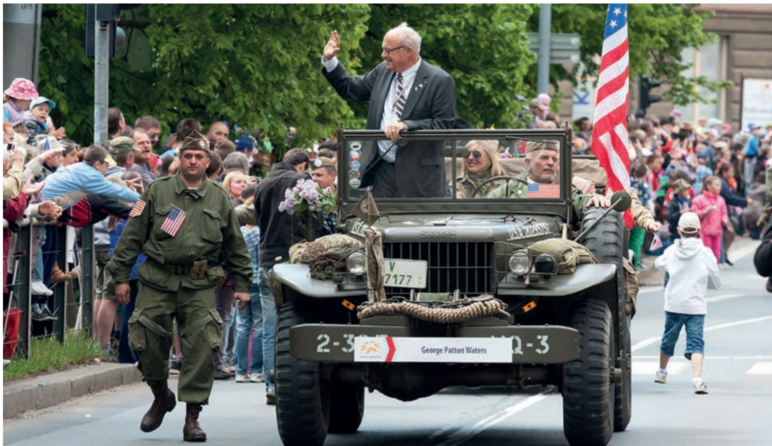
Tisíce lidí sledují každoročně kolonu historických vozidel podél Klatovské třídy. Na snímku zdraví Plzeňany vnuk generála Pattona George Patton Waters.

Letošní Slavnosti svobody se konaly od 2. do 6. května a připomněly již 69. výročí osvobození Plzně americkou armádou.