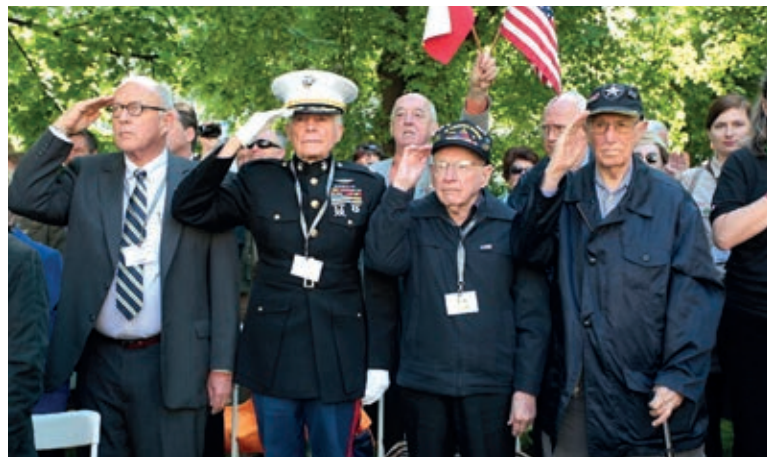
V rámci oslav osvobození se koná i několik pietních aktů. Na snímku veteráni při pietním aktu na Chodském náměstí u památníku 2. pěší divize.

lidi, atmosféru i program oslav. Češi a Američané jsou jako blízcí příbuzní,“ uvedl na největším pietním aktu jeden z válečných veteránů George Thompson ze 16. obrněné divize. V neděli 4. května obdivovaly podél Klatovské třídy kolonu zhru-