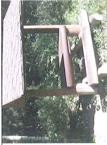
Spodní odpočívadlo – zarostlé, odpadky u odpočívadla