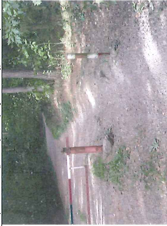
Objezd závory na stezce (také součást cyklistické stezky) – ztižený průchod / průjezd kol – vymleté / vyježděné