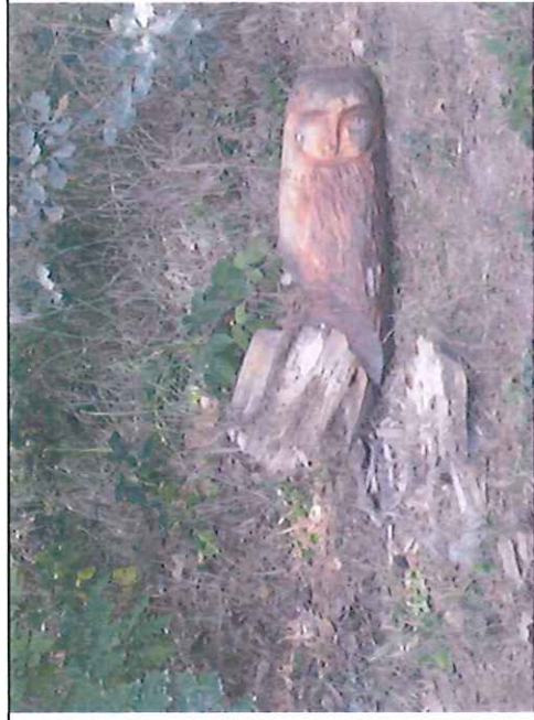
Např. zastavení „Vyřezaná sova“ – povalená, uhlíkový podstavec