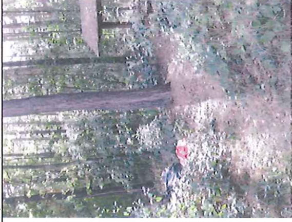
Horní odpočívadlo – zarostlé, odpadky v okolí