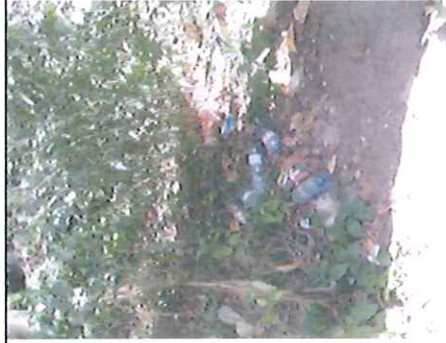
Spodní odpočívadlo – detail