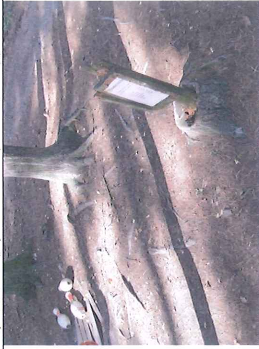
Např. zastavení „Kučelky“ – ulomený držák tabule (popisu), provizorně v pařezu stromu