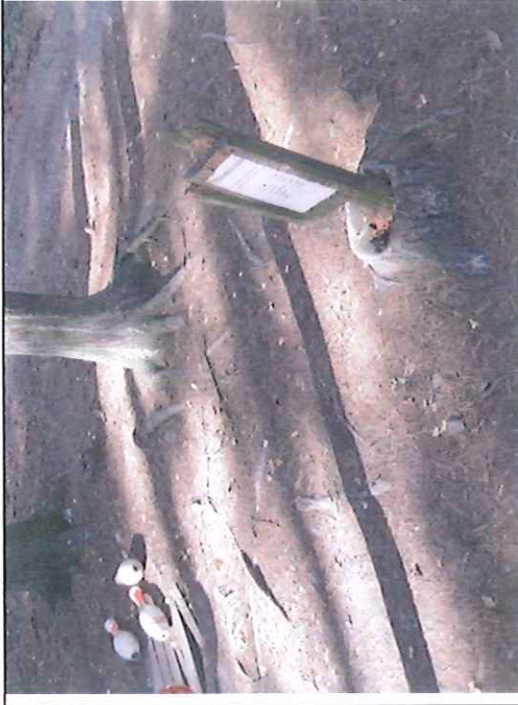
Např. zastavení „Kuželky“ – ulomený držák tabule (popisu), provizorně v pařezu stromu