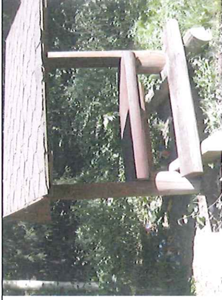
Spodní odpočívadlo – zarostlé, odpadky u odpočívadla