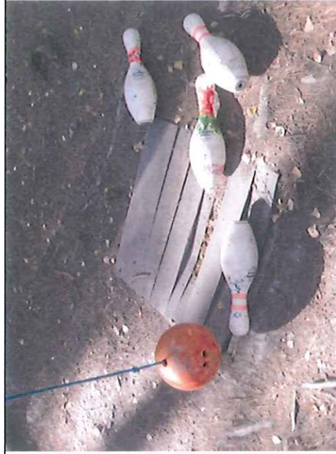
Např. zastavení „Kučelky“ – chybějící kuželky, zlomená prkna stání pro kuželky