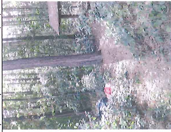
Horní odpočívadlo – zarostlé, odpadky v okolí