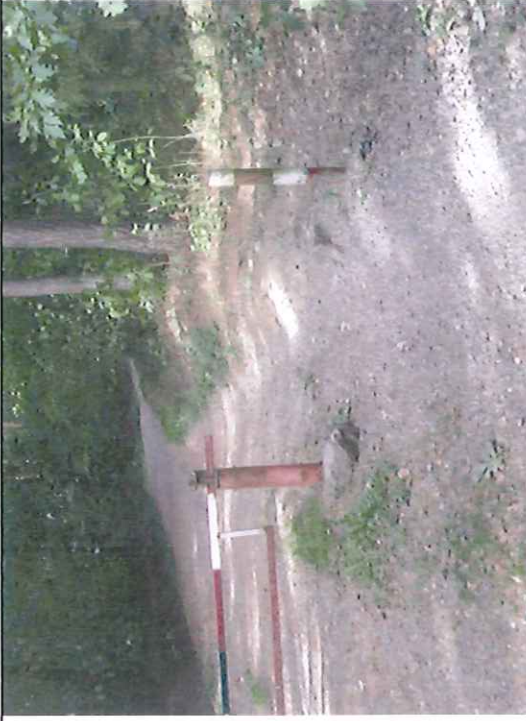
Objezd závory na stezce (také součást cyklistické stezky) – ztížený průchod / průjezd kol – vymleté / vyježděné