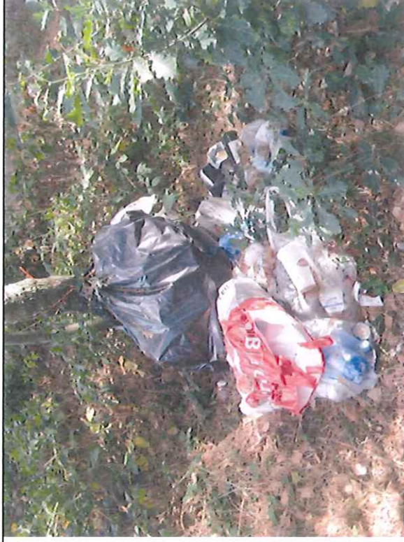
Horní odpočívadlo – odpadky - detail