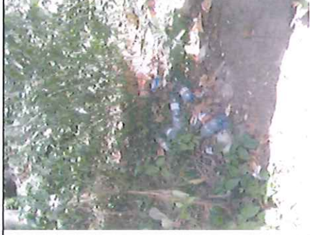
Spodní odpočívadlo – detail