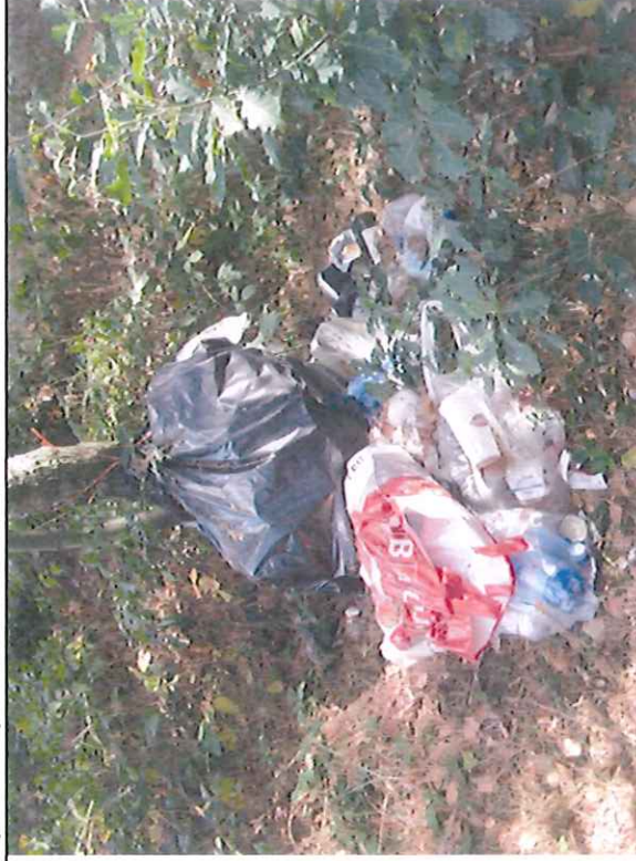
Horní odpočívadlo – odpadky - detail