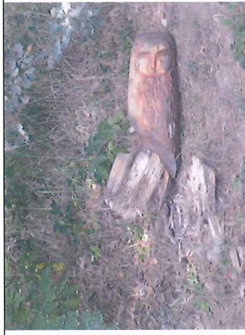
Např. zastavení „Výřezaná sova“ – povalená, uhnilý podstavec