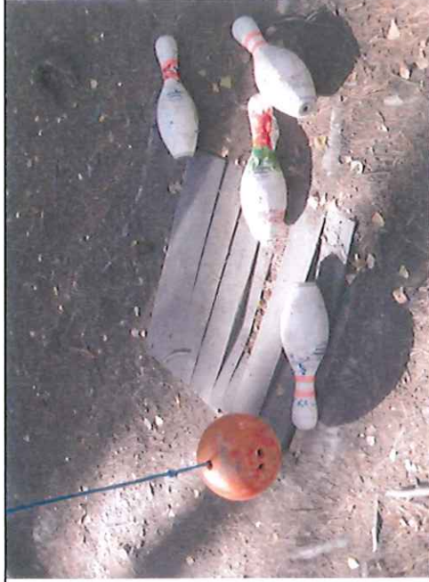
Např. zastavení „Kuželky“ – chybějící kuželky, zlomená prkna stání pro kuželky