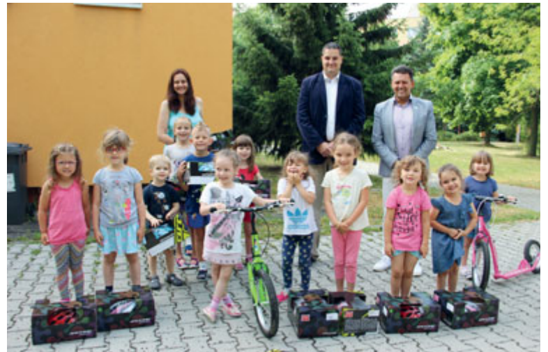
Po teoretické a praktické výuce a následném velkém finále dopravní výuky dětí v předškolním věku věnoval plzeňský centrální obvod mateřským školám na svém území koloběžky a bezpečnostní helmy.