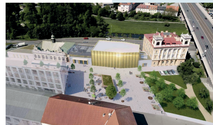
Vizualizace nové podoby náměstí Karla Gotta a KD Peklo

Nové náměstí Karla Gotta vznikne v prostoru, který v následujících letech projde výraznou proměnou. Ambicí města je vytvořit zde moderní, důstojné a živé místo, které přirozeně propojí kulturní život s každodenním setkáváním obyvatel i návštěvníků Plzně.