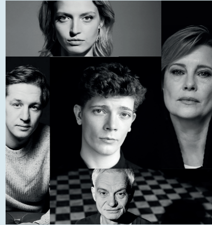
POCEM na divadlo 2026

Hlavní část programu se odehraje na scénách Divadla J. K. Tyla a Městské besedy a nabídne například komedii Každý má svou pravdu v podání Dejvíckého divadla, taneční Tramvaj do stanice Touha souboru Dekkadancers, inscenaci Pořád jsem to já, autorový projekt Můj boj Divadla Na zábradlí, koncertní poctu Édith Piaf, komedii Víkend ve výtahu nebo závěrečné představení Žáby s Ivanem Trojanem.