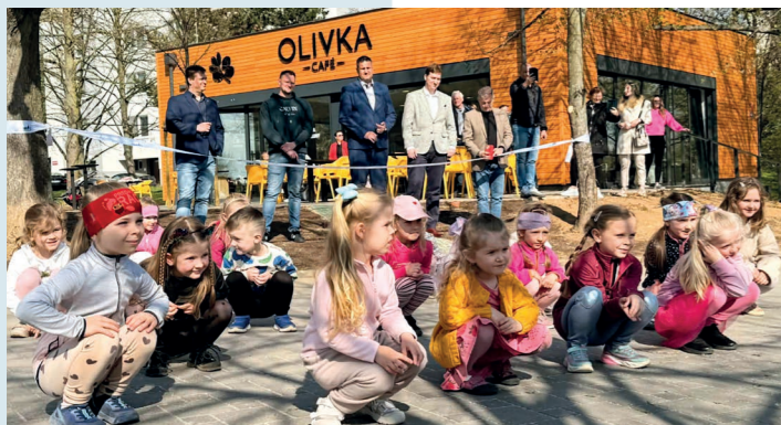
Otevřít kavárnu pomohly děti ze 70. MŠ.

Z nevyužívaných veřejných záchodků vzniklo živé místo pro setkávání. Olivka Café po zhruba měsíčním zkušebním provozu 17. dubna oficiálně slavnostně otevřela, a potvrzuje ambici stát se přirozeným centrem života ve Skvrňanech.