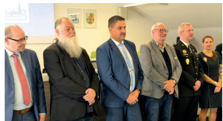
Zakončení Plzeňské senior akademie II

Poděkování zaznělo všem organizátorům i partnerům projektu, včetně Městské policie Plzeň. Připomenut byl také navazující projekt „Bezpečně na cestě i v síti“, na který se mohou senioři těšit.