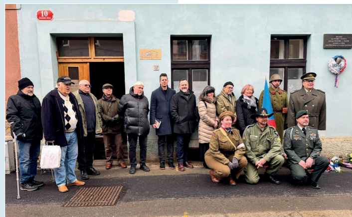
Uctění památky P. Raichla

Výjimečného bojovníka za svobodu, plk. Pravomila Raichla, účastníka II. a III. odboje, který „ve jménu vlasti zůstal nezlomen a nepokořen“, si 7. února připomněl třetí městský obvod.