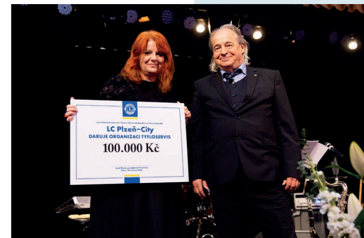
Lions Club Plzeň-City pomáhá výtěžkem z plesu již 28 let.

Zakoupením vstupenky v hodnotě tisíc korun se každý host stává součástí dobročinného záměru a přispívá ke konkrétní pomoci tam, kde má skutečný dopad. Vstupenky je možné objednat prostřednictvím e-mailu lcplzencity@gmail.com nebo kontaktováním sekretáře klubu na adrese j-mares@seznam.cz .