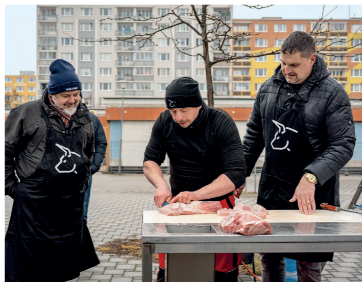
Bourání masa si na Skvrňanech vyzkoušeli i starosta s místostarostou.