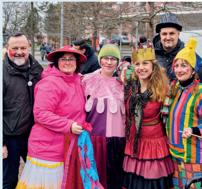
Na Borech nechyběl masopustní průvod v maskách.