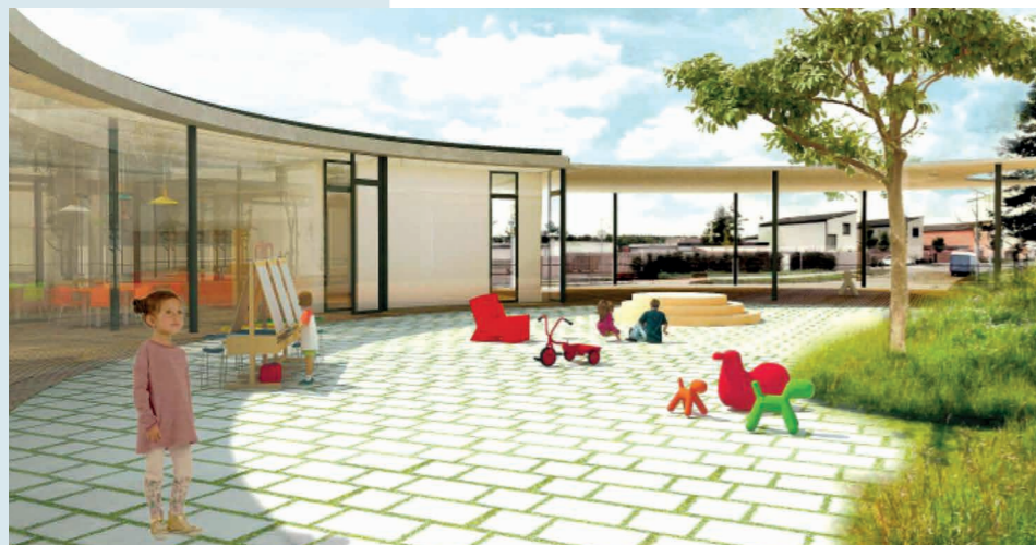
Nová školka bude mít tvar kruhového atria se zelenou střechou.

Na Valše začne na jaře výstavba nové mateřské školy, která nabídne moderní a příjemné zázemí pro 72 dětí. Projekt, po němž místní rodiny dlouhodobě volaly, přinese do lokality dostupné předškolní vzdělávání. Stavbě musely ustoupit dřeviny, které se na místě nacházely.