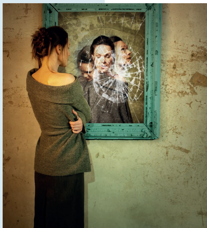
Dogville, DJKT, foto: Irena Štěřbová

Březen do DJKT přinese dvě výrazné činoherní premiéry, které stojí za pozornost milovníků silných příběhů i hereckých výkonů.