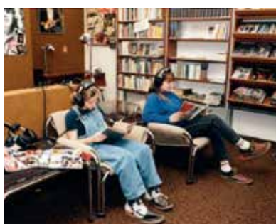
Součástí Obvodní knihovny Lochotín bylo i hudební oddělení, jak ukazuje snímek z roku 1986. Hudební oddělení se v roce 2005 osamostatnilo, přidalo internetové služby a sídlí nyní v Táborské ulici na Slovanech.

Dnešní Obvodní knihovna Bory byla původně od konce 19. století provozována na Říšském (dnes Jižním) předměstí občanskou besedou. Městská knihovna ji převzala ve 20. letech minulého století. Také borská knihovna se během let několikrát stěhovala. V roce 1970, kdy bylo dostavěno sídliště na Borech, byla v Heyrovského ulici, po třech letech se přesunula do nového nákupního střediska Luna, v roce 2006 do