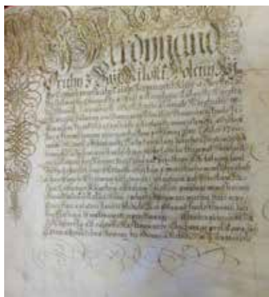
Zlatá bula Ferdinanda II. z roku 1627.

Panovník Ferdinand II. (1578–1637) při své cestě na říšský sněm do Řezna navštívil Plzeň v roce 1623, aby se osobně přesvědčil o zkáze, kterou zde zanechalo mansfeldské vojsko. Odměnou za škody, které město utrpělo, bylo dne 7. srpna 1627 vydání zlaté buly, která byla potvrzením předchozích zlatých bul císaře Zikmunda, Ferdinanda I. a Maxmiliána II. i všech jejich konfirmací, které proběhly od ostatních panovníků v listinné formě bez přivěšení zlaté buly. Obdarování Plzně Ferdinand II. ještě rozhojnil o další milosti. Do Plzně zároveň s Fer-