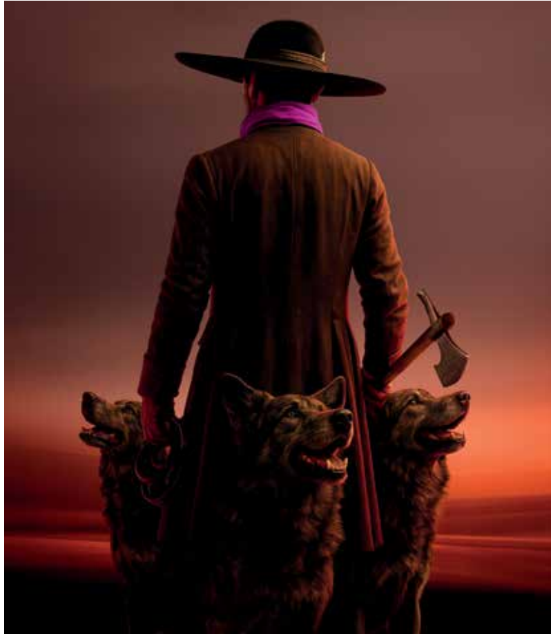
Opera Psohlavci má premiéru ve Velkém divadle 18. dubna, reprízy se konají 24. dubna, 2. května a 7. června.