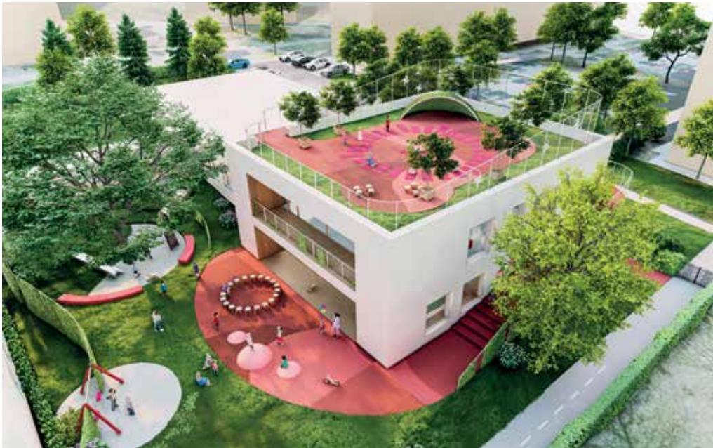
Mateřská škola v Liticích bude dvoupodlažní s orientací na jih a kapacitou pro 116 dětí.

Stavby za více než dvě stě milionů korun navýší kapacitu plzeňských mateřských škol