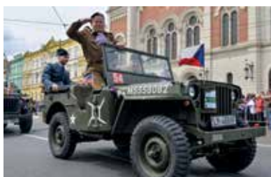
Plzeňské Slavnosti svobody připomínají konec 2. světové války a osvobození města spojeneckými vojsky.

Vyvrcholením programu se stane tradiční Convoy of Liberty. V neděli 3. května v 11 hodin vyjede ze Sukovy ulice kolona historických vojenských vozidel, která za doprovodu přeletů dobových armádních letounů projede po Klatovské třídě až do sadů Pětatřicátníků.