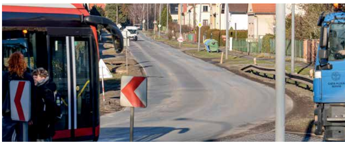
Na Bílé Hoře začne kompletní rekonstrukce zhruba kilometrového úseku ulice 28. října.

Revitalizace této části náměstí Republiky si vyžádá dopravní opatření. Dojde k uzavírcí západní strany mezi ulicemi Solní a Prešovská. Na chodníku podél fasád přilehlých domů bude vždy zajištěn průchod v šíři dvou metrů. Riegrova ulice bude v místě náměstí Republiky pro auta zaslpena, ale pro pěší bude zajištěn průchod na plochu náměstí a ke vstupu do katedrály. Pro potřeby stavby bude část plochy náměstí oplocena a vzhledem