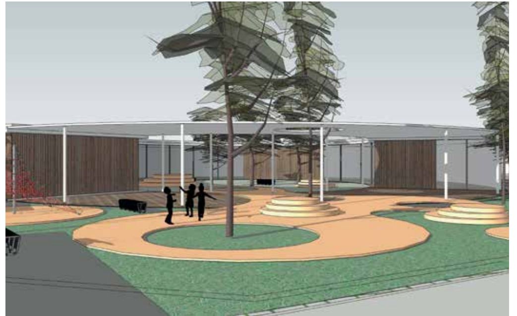
Na Valše bude mateřská školka moderní jednopodlažní dřevostavba ve tvaru kruhového atria.