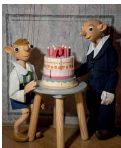
Hurvínek letos slaví stovku. Mezi gratulanty je i tatulda Spejbl.

Postava legendární loutky Hurvínek patří již celé století k neznámějším symbolům českého loutkářství. Hurvínek se poprvé na jevišti objevil 2. května 1926 jako nová postava při představeních Loutkového divadla Feriálních osad v Plzni. Jeho dřevěnou podobu vytvořil řezbář Gustav Nosek, který spolupracoval s loutkářem Josefem Skupou. Plzeň letos slaví narozeniny svého slavného roďáka bohatým programem. Série výstav, vzdělávacích programů, festivalových představení i odborných setkání ukáže, že postava zvidavého a trochu rošťáckého chlapce si dokáže získávat nové generace diváků i po sto letech od svého vzniku.