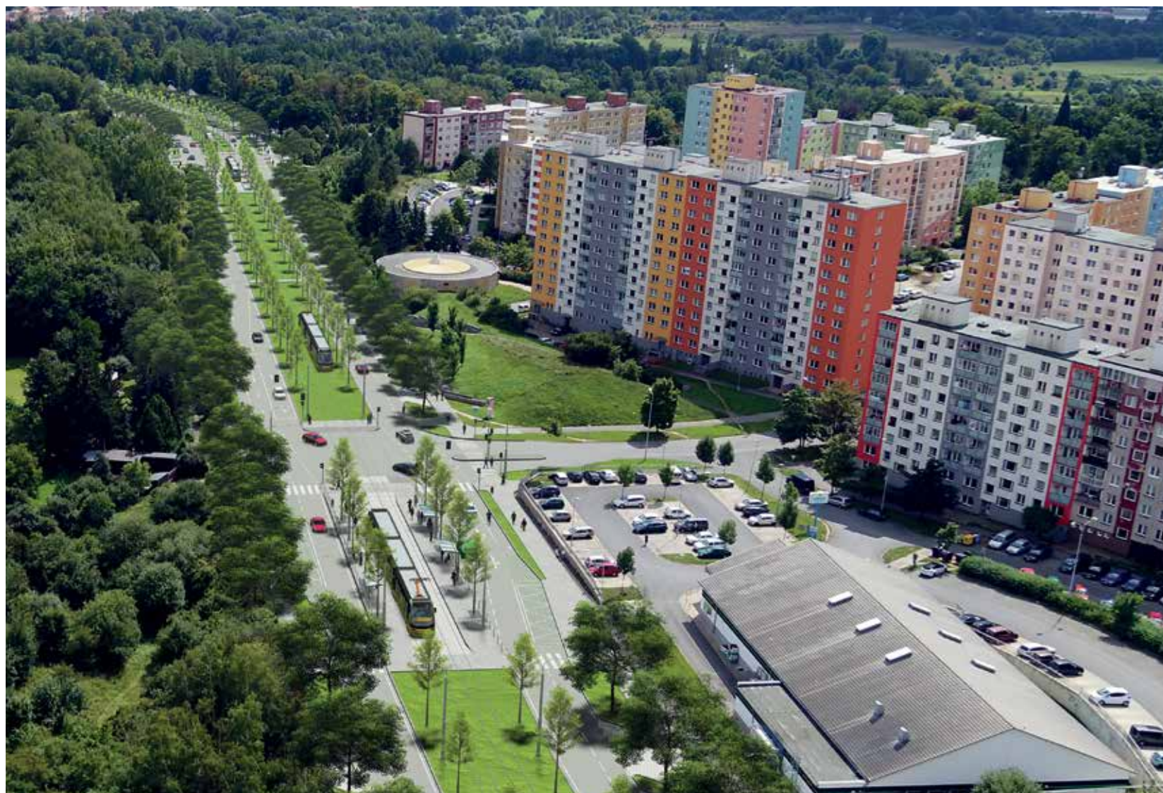
Vizualizace ukazuje ozeleněný pás ulice Na Chmelnicích, jímž povede nová tramvajová trať na Vinice.

Město Plzeň podá žádost o dotace z Programu Doprava 2021–2027 Infrastruktura městské drážní dopravy (novostavby a modernizace), specifický cíl Podpora udržitelné multimodální městské mobility v rámci přechodu na uhlíkové neutrální hospodářství. V případě úspěšné žádosti by dotace mohla činit více než 700 milionů korun. Město počítá s předfinancováním projektu ve výši 100 procent.