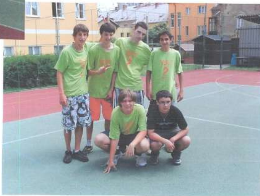
2. místo IX. B

Mesi nejoblíbenější a fanoušky nejdedovaznější disciplinová patří především fotbal. Třetími měří svou výmě 6. - 9. tříd. Prvními a kulovní pohár letos vybojovali žáci IX. A, kteří v minulosti se celý školní rok těsně předstihli s IX. B