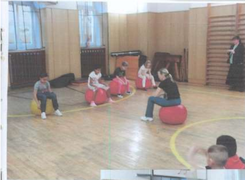
Kroužek aerobicy - vítězů ve městě