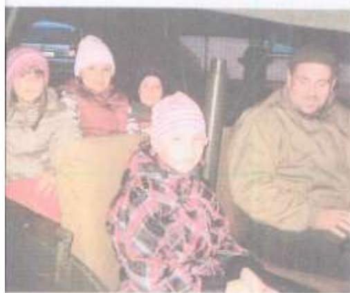
tradici se děti nejvíce těší na jízdu terénními auty.