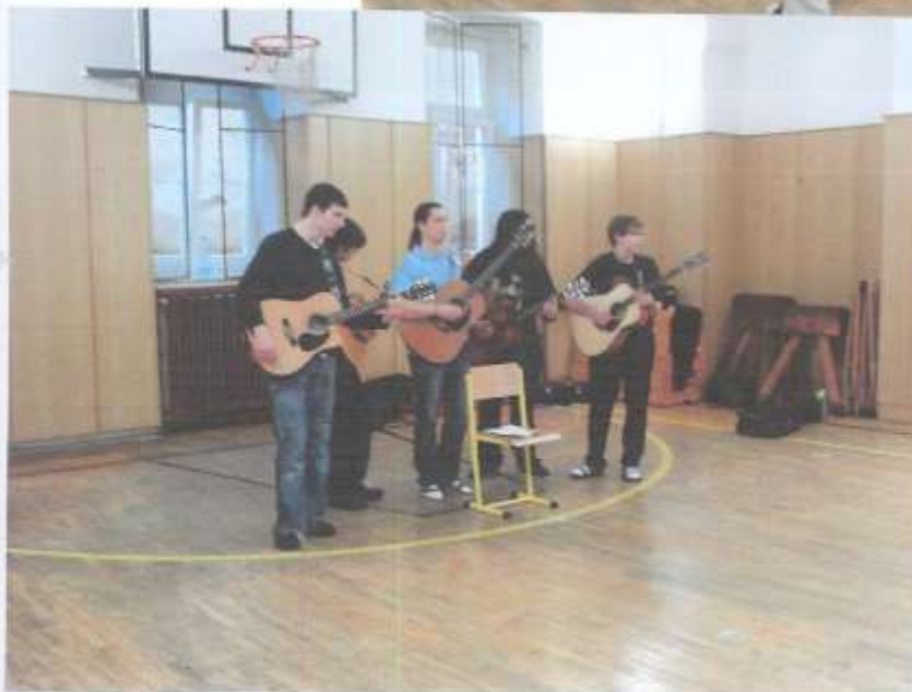
Kroužek hry na akustickou kytaru