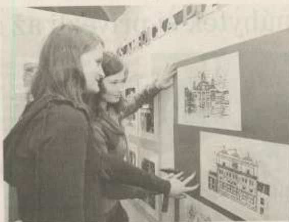
VÝSTAVA je od pátku připravená. Během zítřejší vernisáže nebudou chybět taneční a hudební vystoupení dětí.

Zhruba dvě třetiny prací jsou dílem plzeňských dětí ze školy na Americké třídě a z odloučených pracovišť, zbytek obrázků přicestoval ze Žiliny. Výstava potrvá do 20. dubna. Za rok se role vymění a vy-