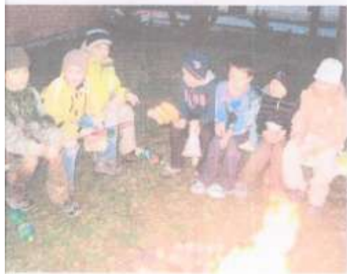
raději nechybělo ani opékání vařtů.