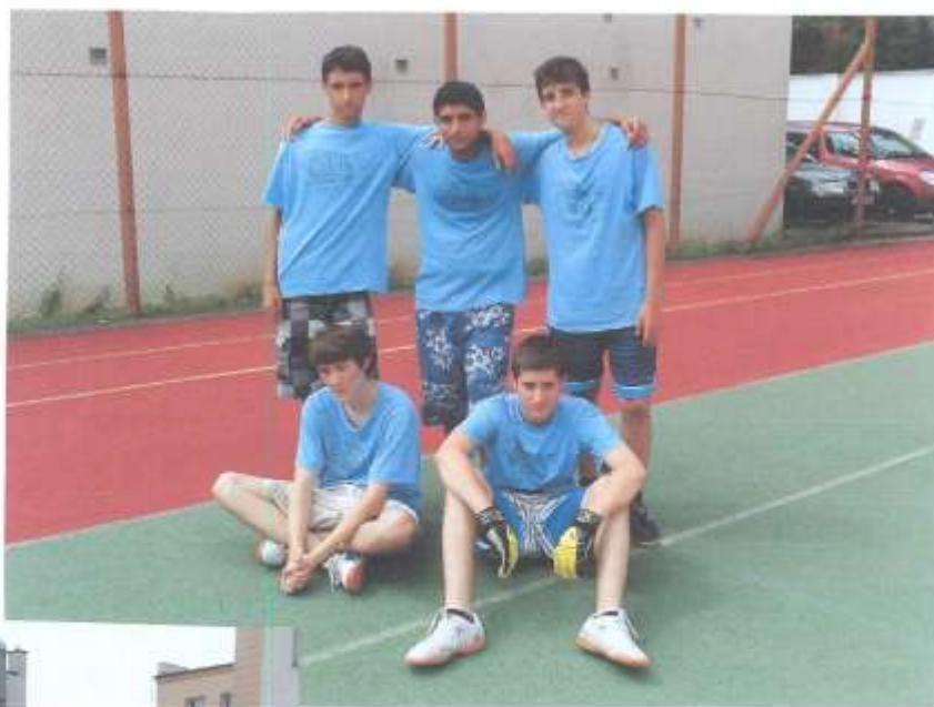
1. místo IX. A