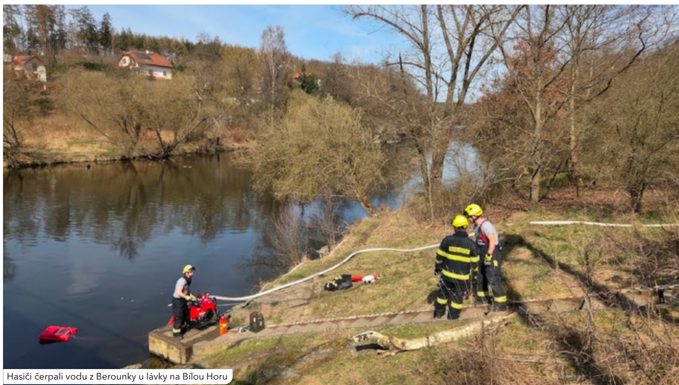
Hasiči čerpali vodu z Berounky u lávky na Bílou Horu