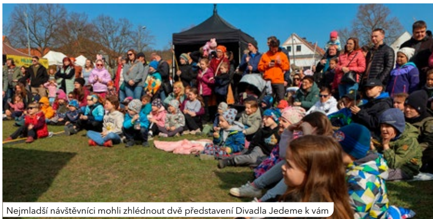
Nejmladší návštěvníci mohli zhlédnout dvě představení Divadla Jedeme k vám