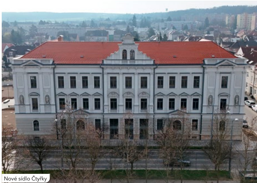
Nové sídlo Čtyřky

U zadního traktu budovy úřadu bude připravena stezka s úkoly pro děti nazvaná Postav si svůj dům, kde se představí místní neziskové organizace a další subjekty jako Totem, hasiči, městští policisté, skauti nebo obvodní knihovna. Děti se mohou těšit také na pohádku v podání divadla Špalíček a představí se i divadlo Pluto.