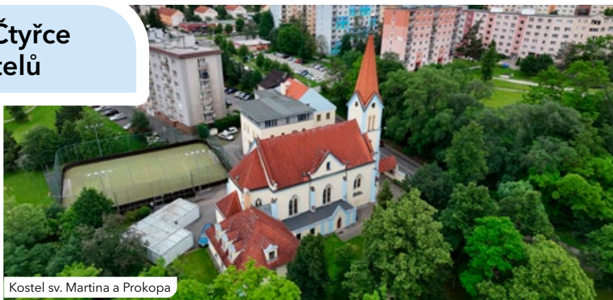
Kostel sv. Martina a Prokopa