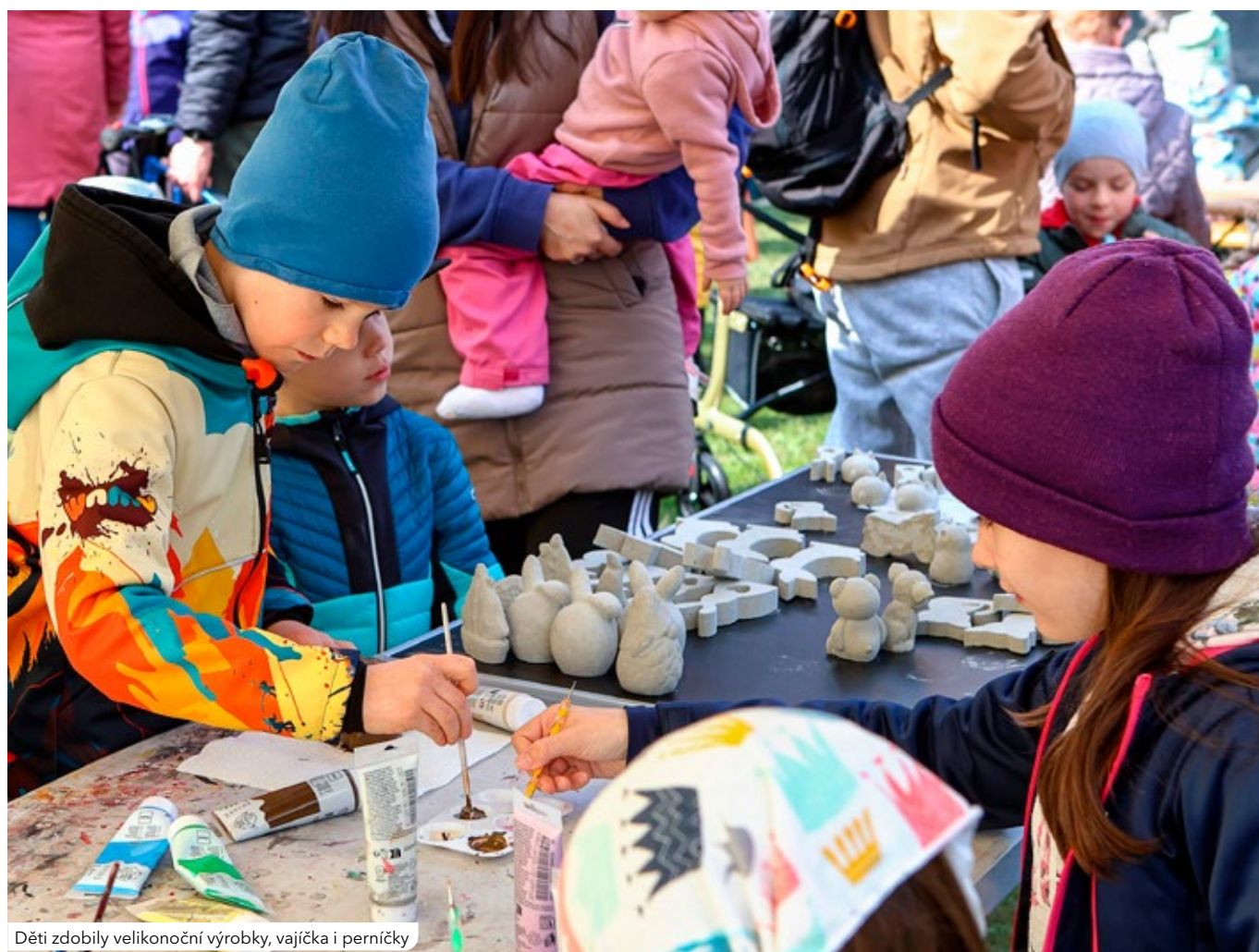
Děti zdobily velikonoční výrobky, vajíčka i perníčky