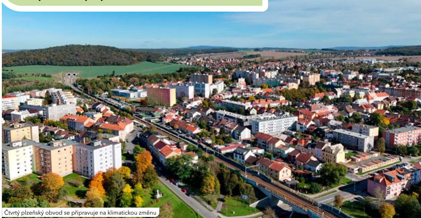
Čtvrtý plzeňský obvod se připravuje na klimatickou změnu

Městský obvod Plzeň 4 připravuje klíčový dokument s názvem Strategie adaptace na klimatickou změnu. Hlavním cílem je vytvořit bezpečný a odolný obvod, který díky modernímu hospodaření s vodou a rozvoji zeleně ochrání zdraví a pohodlí svých obyvatel. Počítá s dalším vysazováním zeleně, aby stín vzrostlých stromů a blízkost vodních prvků zajistily příjemné prostředí i během horkých letních dnů. Strategický dokument bude veřejnosti představen 6. května od 17 hodin v prostorách nového úřadu v Masarykově ulici. Poté je připravena přednáška uznávaného geografa a hydrologa Bohumíra Janského, který má na svém kontě světový objev pramenů řeky Amazonky. Hovořit bude o dopadech klimatické změny na vodní hospodářství Česka.