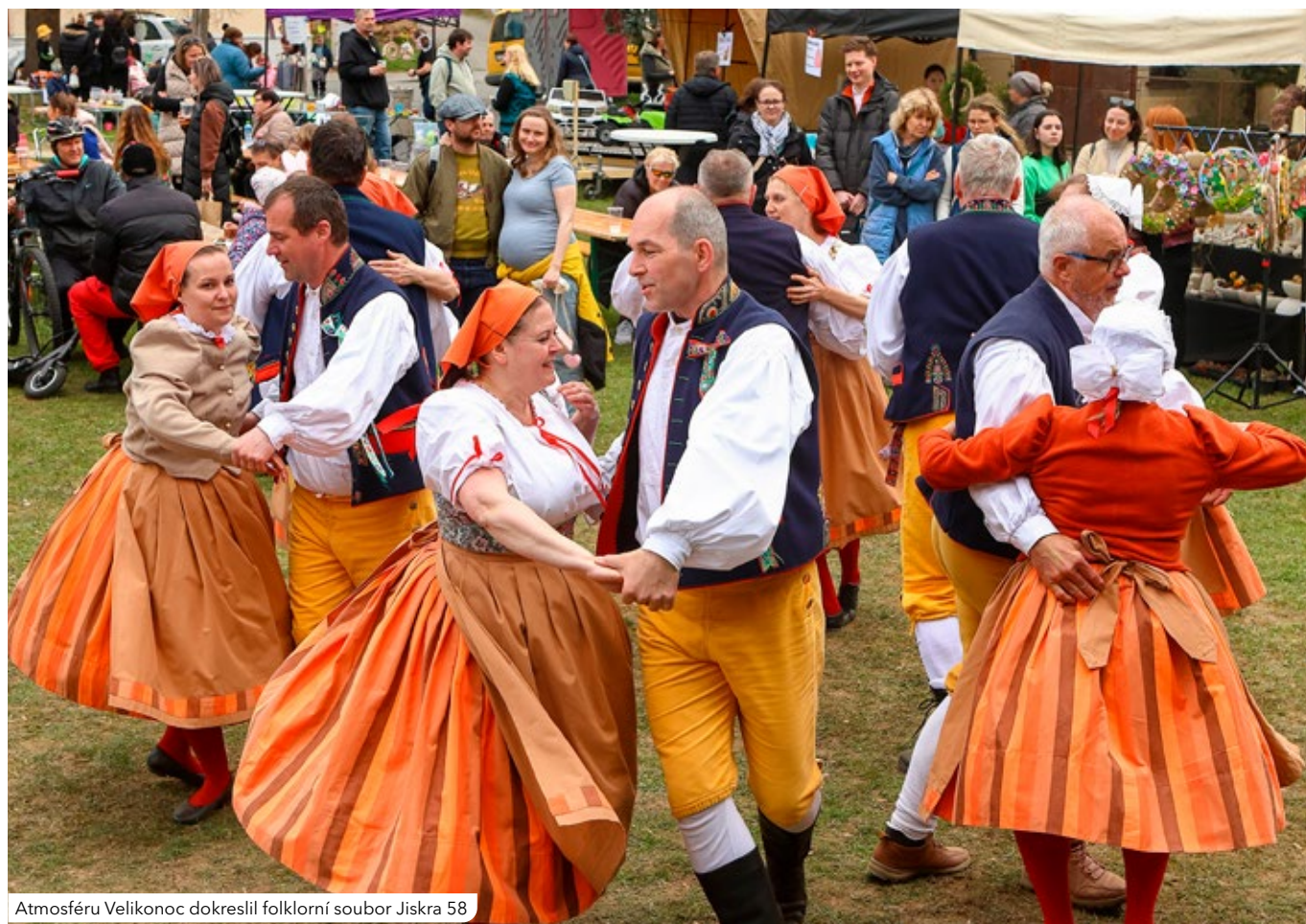
Atmosféru Velikonoc dokreslil folklorní soubor Jiskra 58