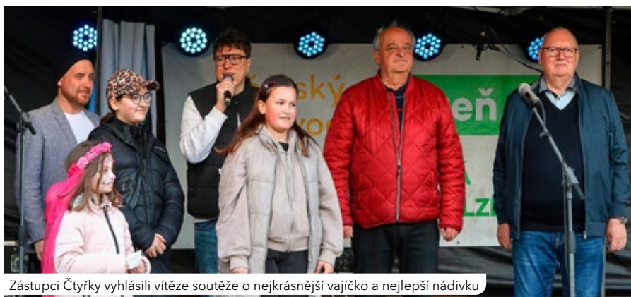
Zástupci Čtyřky vyhlásili vítěze soutěže o nejkrásnější vajíčko a nejlepší nádivku