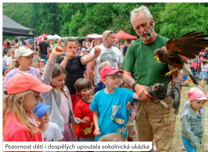
Pozornost dětí i dospělých upoutala sokolnická ukázka