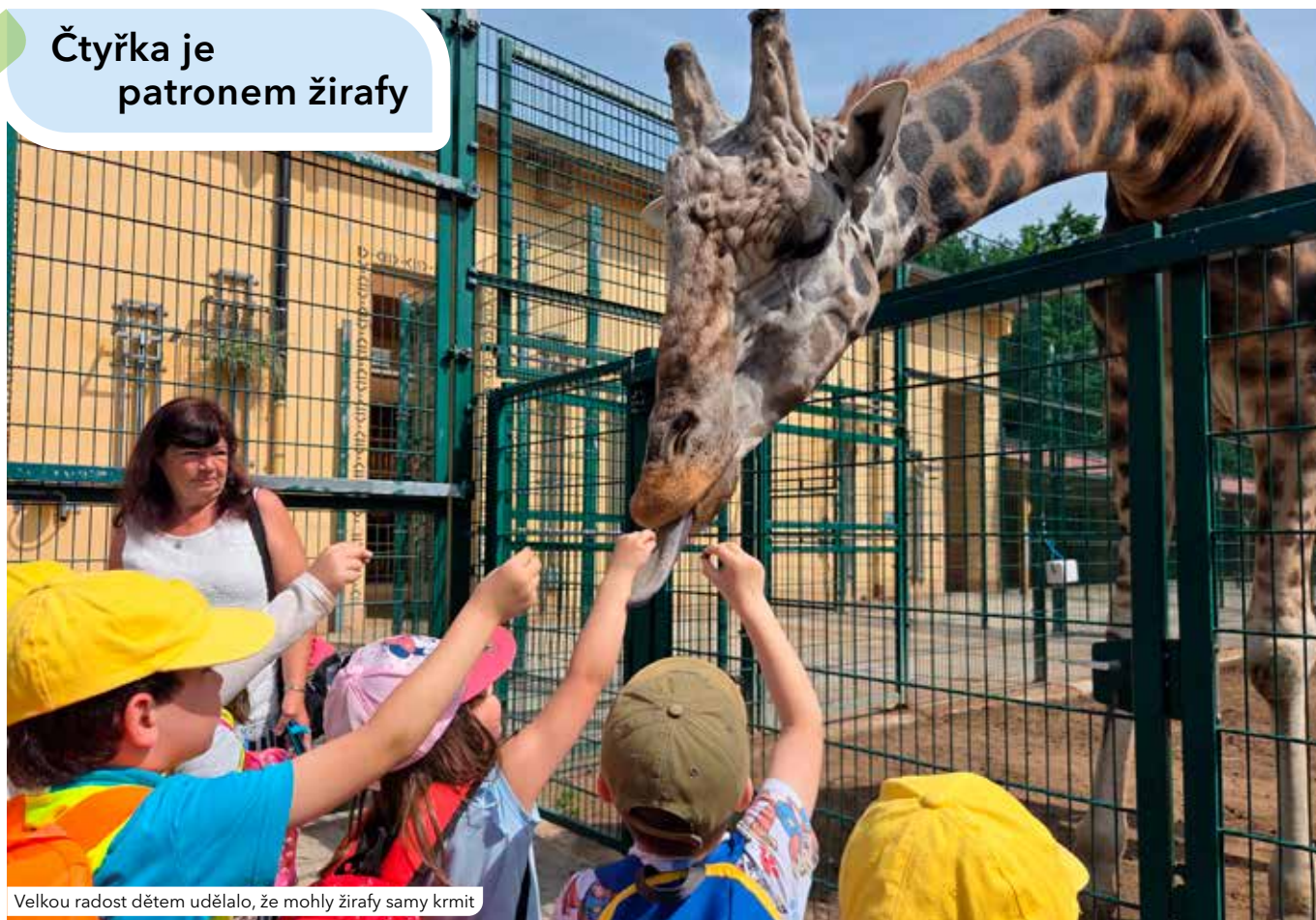
Velkou radost dětem udělalo, že mohly žirafy samy krmít

Roční patronát nad dalšími zvířaty plzeňské zoologické zahrady převzali zástupci Čtyřky společně s předškoláky z 57. mateřské školy Nad Dalmatinkou. Čtvrtý plzeňský obvod tak každoročně finančně podpoří chov konkrétních zvířat a zároveň při té příležitosti získá vstupné pro stovky dětí z místních mateřských škol. Letos se jich sem vypravilo skoro sedm set.