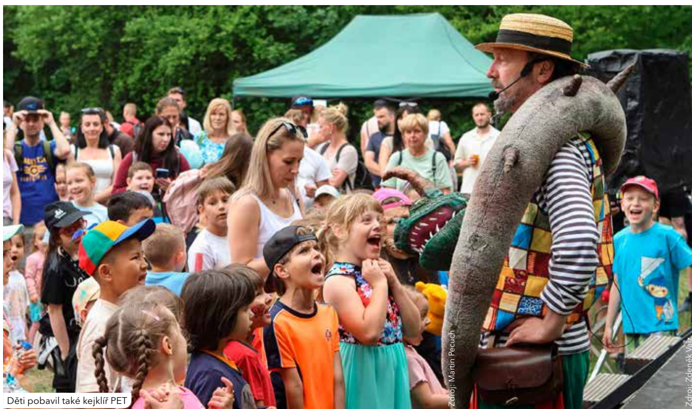
Děti pobavil také kejklíř PET