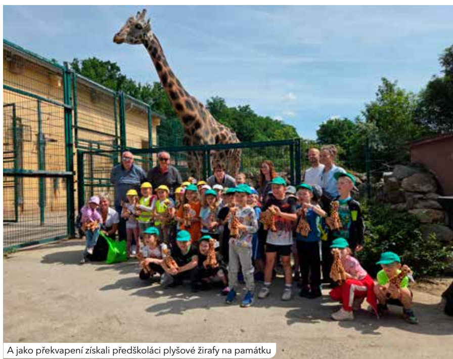
A jako překvapení získali předškoláci plyšové žirafy na památku

V uplynulých dvou letech byla Čtyřka patronem kapybary Báry. V minulosti pak převzala patronát nad vzácným bílým rakouskouherským oslem Rudolfem II., koníkem Chlumem nebo samičí hrošíka jménem Doubravka.