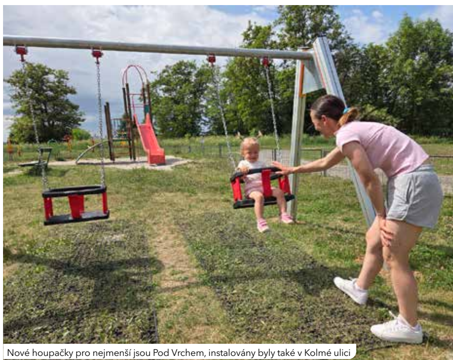
Nové houpačky pro nejmenší jsou Pod Vrchem, instalovány byly také v Kolmé ulici

Loni bylo dokončeno multifunkční hřiště s umělým povrchem v ulici Pod Švabinami v Lobzích, které nabízí možnost hrát malou kopanou, basketbal, házenou, tenis, volejbal a vybíjenou. V úložném boxu u hřiště najdou zájemci potřebné vybavení na míčové hry, tedy síť a sloupky, na které se síť přichytí. Stačí napsat sms zprávu na telefonní číslo, které je uvedeno u úložného boxu. Jakmile dorazí pin kód, je třeba jej zadat na klávesnici u elektronické schránky na klíče. Pak už stačí jen pomocí klíče otevřít úložný box. Důležité je pak zase půjčené vybavení vrátit zpět do boxu a klíče do schránky. Sportoviště bylo zrekonstruováno na přání obyvatel v rámci participativního rozpočtu Rozhodněte sami.