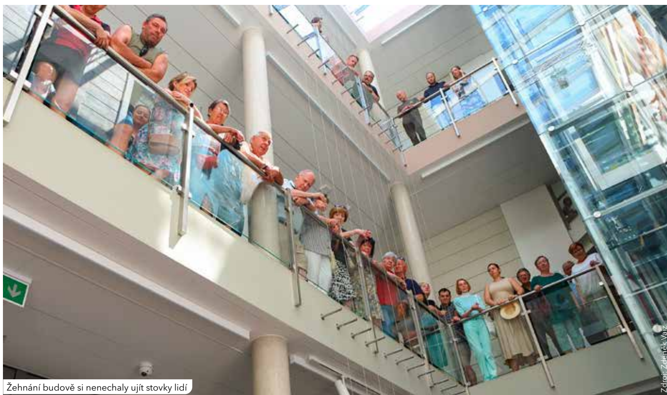
Žehnáni budově si nenechaly ujít stovky lidí