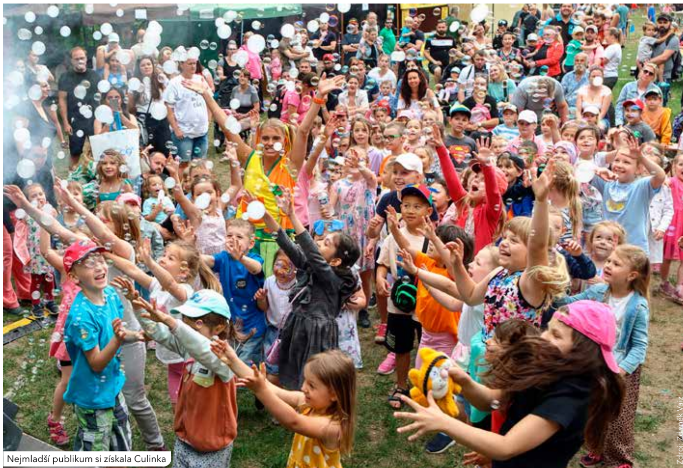
Nejmladší publikum si získala Culinka