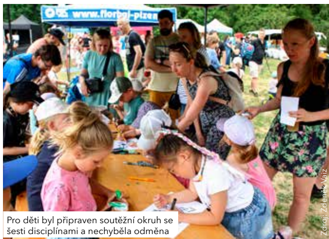
Pro děti byl připraven soutěžní okruh se šesti disciplínami a nechyběla odměna

„Dětský den pravidelně umísťujeme do Lobežského parku, který mají děti moc rády. Navíc jsou atrakce doplněny o herní prvky, které park nabízí. Každý si tak najde, co ho baví, a děti tady vždy stráví velmi příjemné odpoledne,“ dodává místostarosta Čtyřky Zdeněk Mádr.