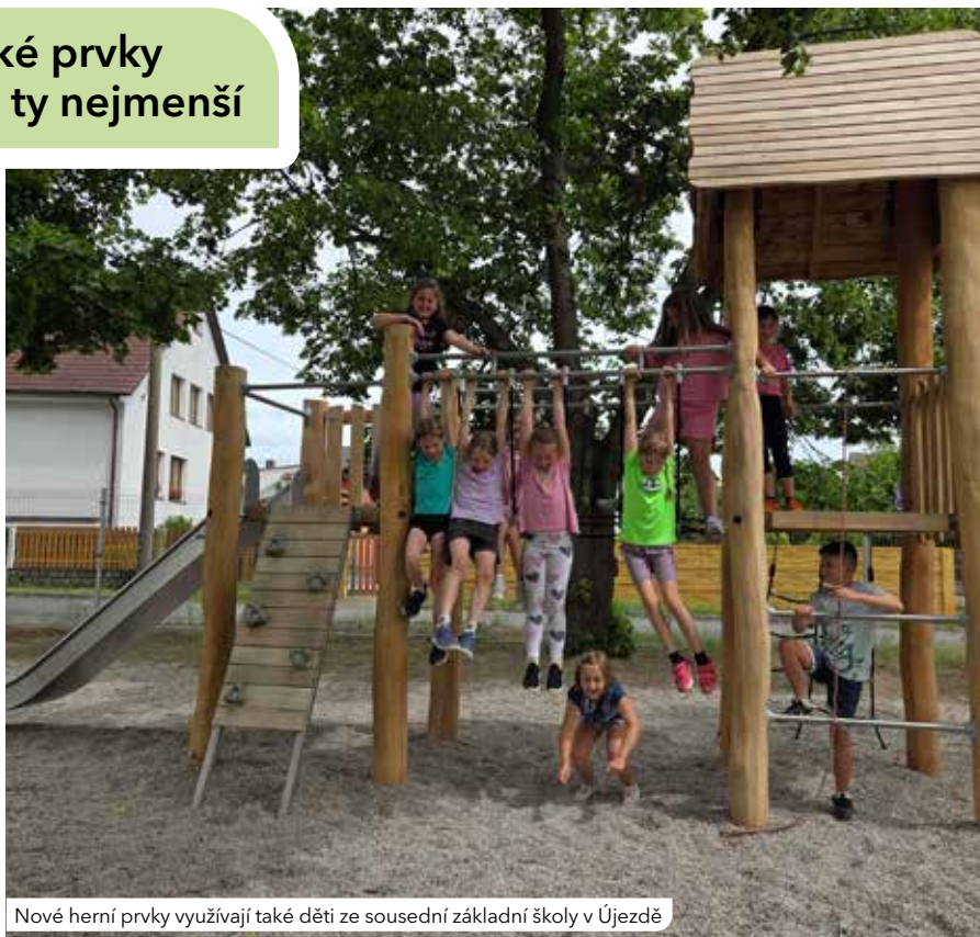
Nové herní prvky využívají také děti ze sousední základní školy v Újezdě

Závěsné houpačky pro nejmenší se speciálními sedátky přibily v doubravecké Kolmé ulici a na hřišti Pod Vrchem v Lobzích. „Dostali jsme podnět od obyvatel, že houpačky se speciálními sedáky pro nejmenší děti v obvodě chybí, rádi jsme proto vyhověli. V současnosti řešíme další lokality, kde bychom mohli umístit další podobné houpačky,“ říká starosta obvodu Tomáš Soukup. S instalací závěsných houpaček pro nejmenší začal