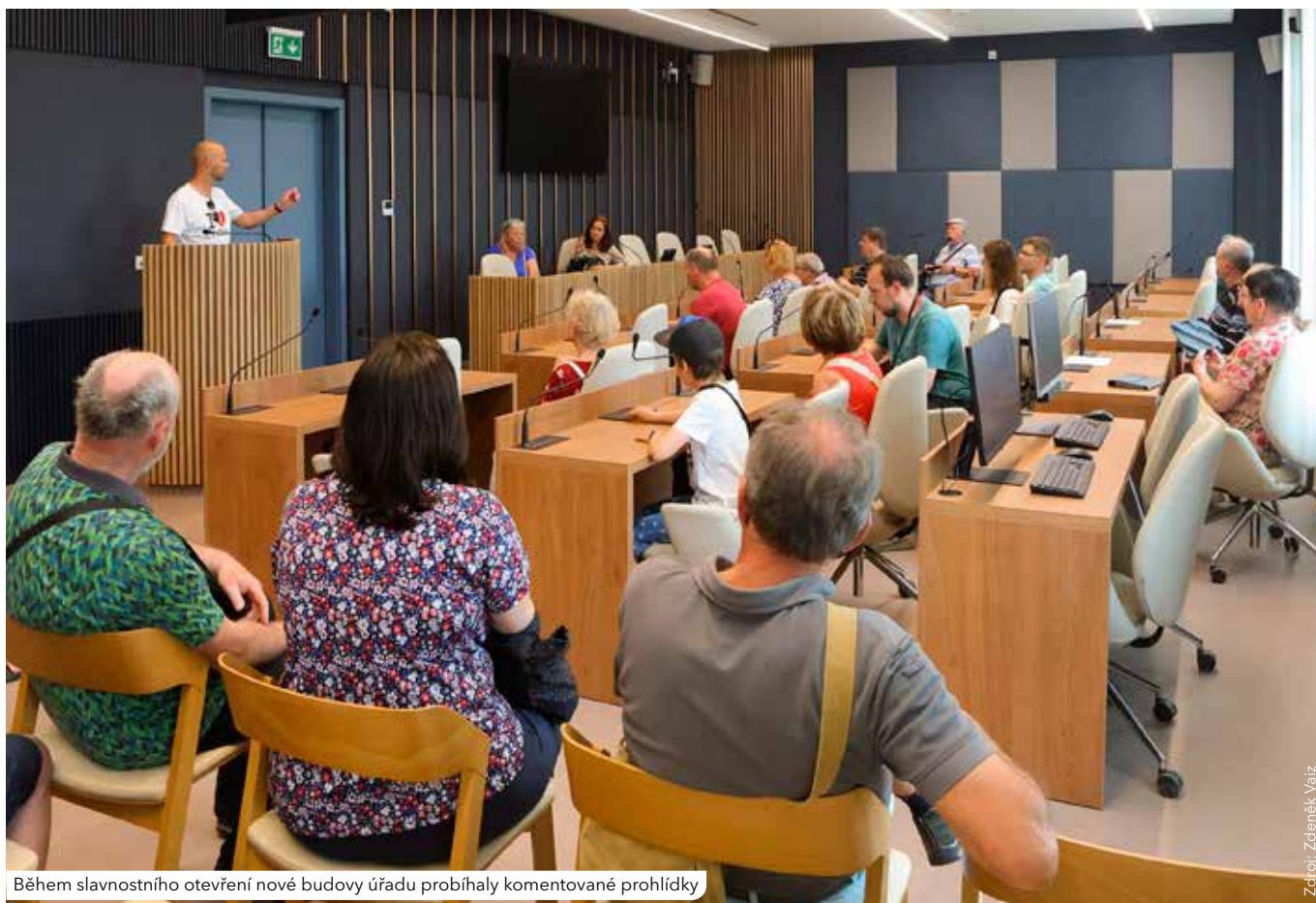
Během slavnostního otevření nové budovy úřadu probíhaly komentované prohlídky