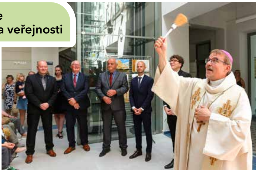
Budově požehnal plzeňský biskup Mons. Tomáš Holub za doprovodu pěveckého souboru Javoříčky

„Objekt bývalé školy na Doubravce na svou záchranu čekal desítky let, nyní se po rekonstrukci otevírá. Mám radost, že jsme v něm vytvořili funkční a moderní zázemí pro výkon veřejné správy, dokazuje to, že Plzeň umí efektivně investovat do svého majetku a vracet život významným budovám. Věřím, že lidé proměnu ocení,“ uvedl primátor města Plzně Roman Zarzycký s tím, že většinu finančních prostředků na realizaci zaplatilo právě město ze svého rozpočtu. S rekonstrukcí radnice Čtyřky se začalo předloni v březnu, během letošního dubna bylo vše přestěhováno a Úřad městského obvodu Plzeň 4 začal naplno fungovat v no-