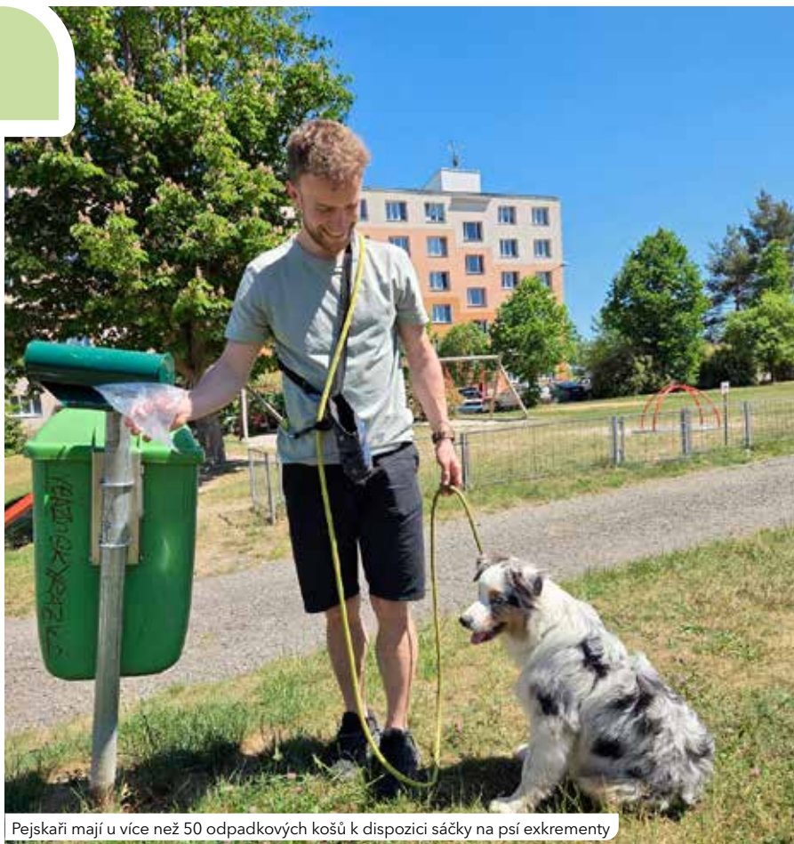
Pejskaři mají u více než 50 odpadkových košů k dispozici sáčky na psí exkrementy

„Chtěli jsme zachovat co největší komfort pro pejskaře. Chceme také podpořit každého, kdo po svém pejskovi uklízí. Proto musí mít každý majitel psa k dispozici tuto službu, a to co nejlíže,“ říká starosta Čtyřky Tomáš Soukup. Stojany se sáčky doplňují pracovníci Čisté Plzně jednou měsíčně, a to vždy první středu v měsíci. „Průběžně se snažíme doplňovat sáčky také vlastními silami. Kdo bude potřebovat, je možné si pro ně přijít k nám na radnici,“ dodává místostarosta Jan Kakeš. Ve stojanech u odpadkových košů jsou sáčky igelitové, na recepci Úřadu městského obvodu Plzeň 4 lidé dostanou jak igelitové, tak papírové s lopatkou, která je vyrobena z tvrdého kartonu. Jednorázová plasto-