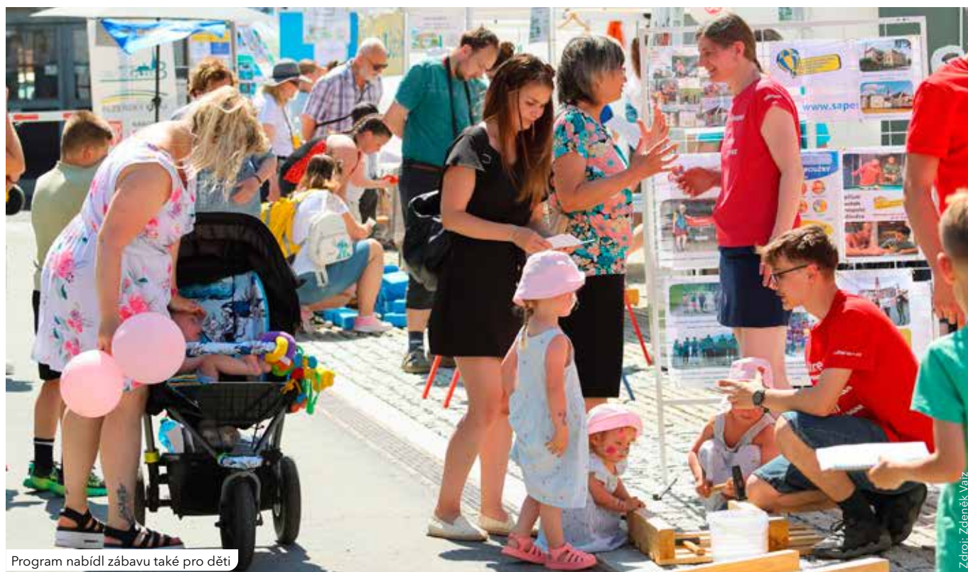
Program nabídl zábavu také pro děti