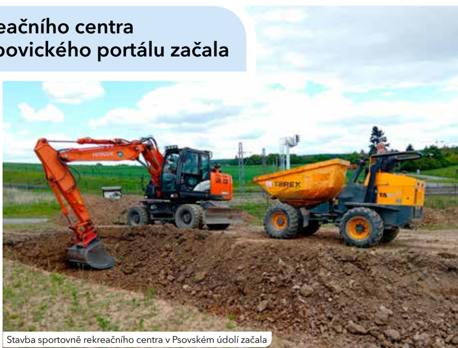
Stavba sportovně rekreačního centra v Psovském údolí začala

Sportovně rekreační centrum poskytne zázemí v místě nástupu na cyklostezku po zaniklé železniční trati z Plzně do Chrástu. Projekt je navržen tak, aby co nejvíce zapadl do okolní krajiny. Hotovo by mělo být do konce září. Odhadované náklady by se měly pohybovat kolem 25 milionů korun.