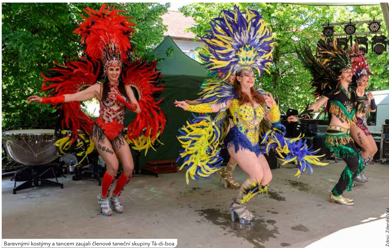
Barevnými kostýmy a tancem zaujali členové taneční skupiny Tã-di-boa