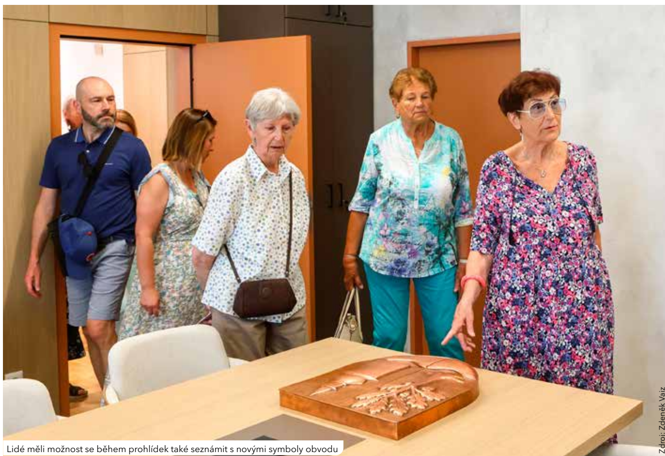
Lidé měli možnost se během prohlídek také seznámit s novými symboly obvodu