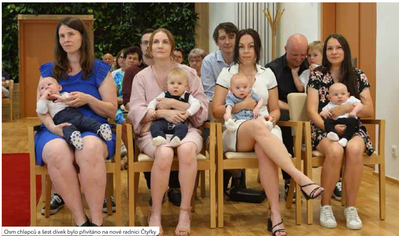
Osm chlapců a šest dívek bylo přivítáno na nové radnici Čtyřky