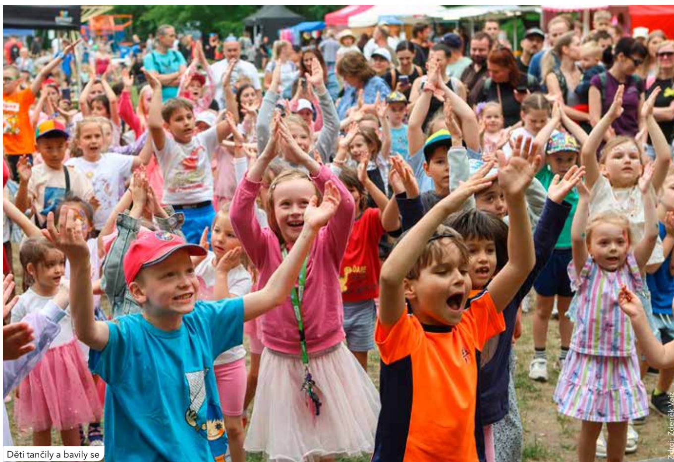
Děti tančily a bavily se