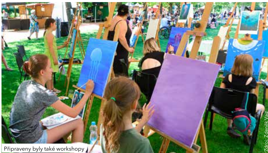
Připraveny byly také workshopy