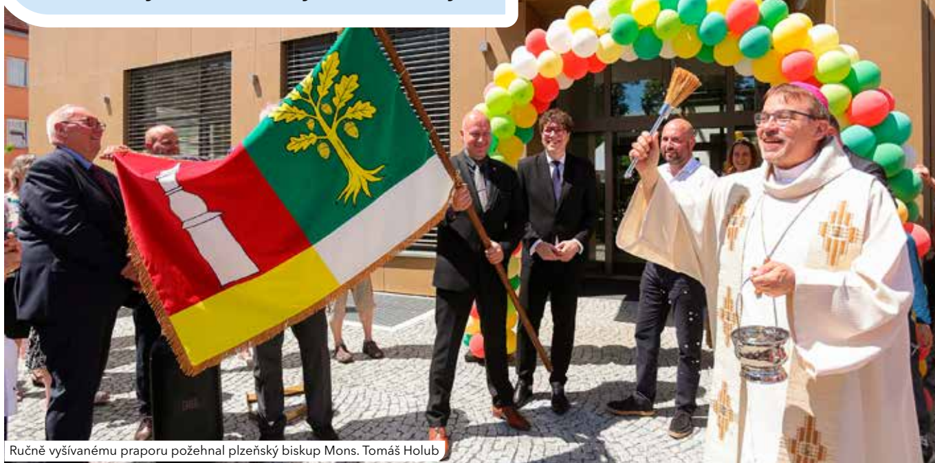
Ručně vyšívanému praporu požehnal plzeňský biskup Mons. Tomáš Holub

Čtvrtý plzeňský obvod má poprvé ve své historii svůj znak a vlajku. Symboly byly poprvé představeny při slavnostním otevření nové radnice. Znak odkazuje k historii Doubravky, kostelu sv. Jiří i soutoku Úslavy a Berounky. Podobu znaku a vlajky schválili v březnu zastupitelé, na začátku května bylo předsedou poslanecké sněmovny vydáno rozhodnutí o udělení symbolů.