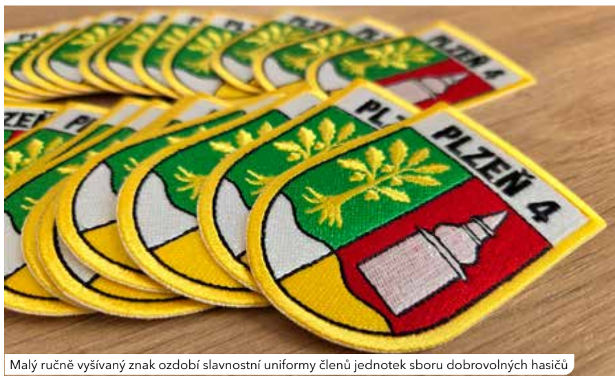
Malý ručně vyšívaný znak ozdobí slavnostní uniformy členů jednotek sboru dobrovolných hasičů

Čtvrtý obvod a Černice jsou jednými plzeňskými obvody, které mají svůj znak a vlajku. Černice mají své symboly od loňského září.