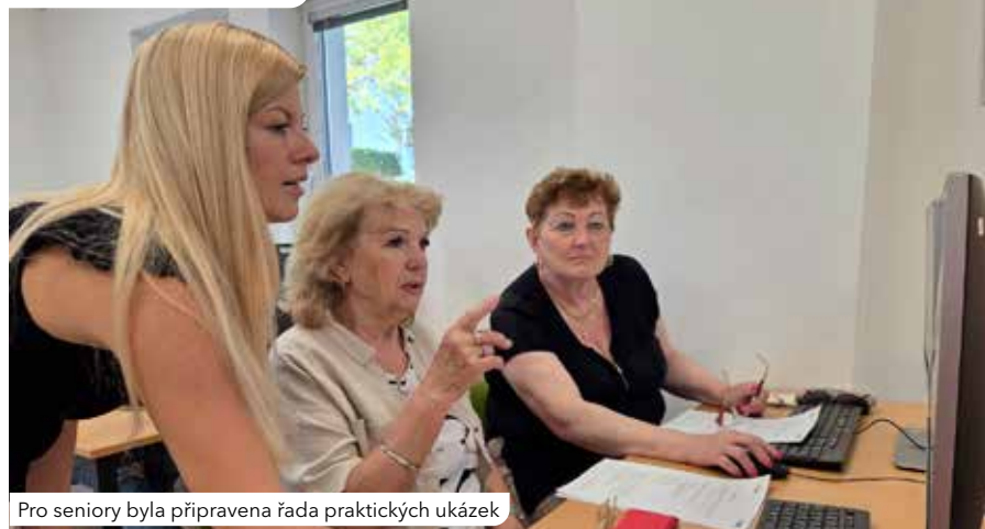
Pro seniory byla připravena řada praktických ukázek

Senioři se učili bezpečně se orientovat v kyberprostoru, rozpoznávat upravené fotografie, vyhodnocovat důvěryhodnost zdrojů a také se seznámili s principy fungování AI. Používání umělé inteligence si vyzkoušeli při praktických cvičeních. Během workshopu se ale senioři také