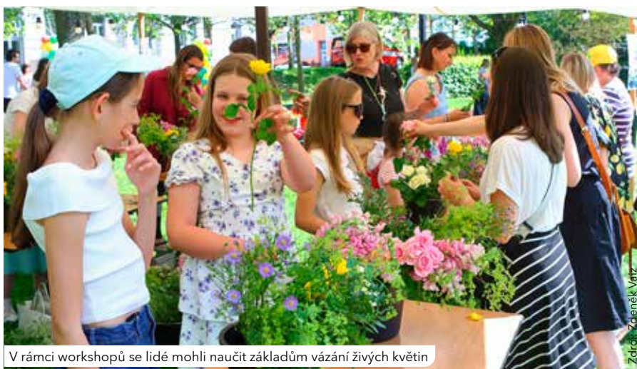
V rámci workshopů se lidé mohli naučit základům vázání živých květin