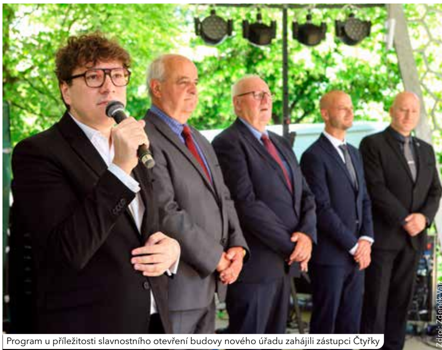
Program u příležitosti slavnostního otevření budovy nového úřadu zahájili zástupci Čtyřky