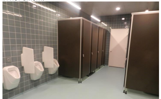
Jongenstoilet begane grond

Tijdens de pauze gebruik je de toiletten beneden in het atrium.