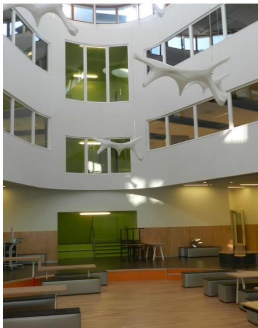
De groene trap in het Atrium

Iedere leerling heeft in het domein een eigen locker. Daarin kan je al je spullen bewaren. Als je schoolgeld is betaald krijg je een sleutel om je locker af te sluiten.