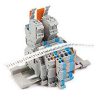
PP+ - na złączki ▶ PATRZ STRONA 104