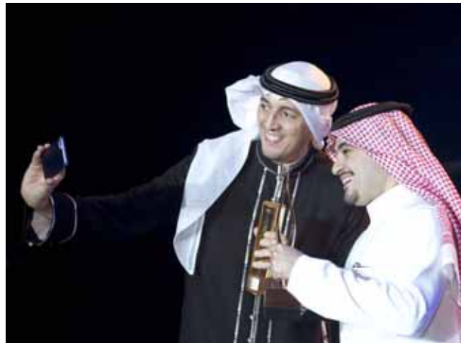
... وهناك دور للسلفي