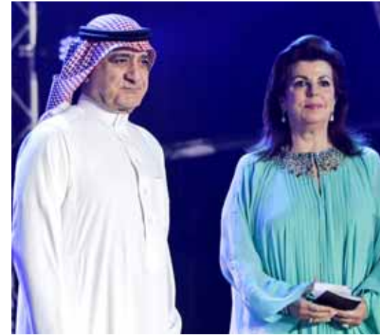
...ولقطه من الحفل

اعتزاز كبير بقدرات وطاقت العرب في كل مجال وفي كل مكان. - المعنى الثالث: هو أن مبادرة «تكريم» تحمل أيضا نظرة واثقة في مستقبل الأمة العربية وكذلك سعي جاد لدينا جميعا بأن نحقق الافادة الكاملة، من العنصر البشري للامة، وأن نعمل جاهدين بكل جد وعزم لإتاحة الفرصة الكاملة أمام أبناء وبنات هذه الأمة للاسهام في تحقيق التقدم والتطور في بلدانهم، بل وأيضا القيام بدور مهم في سبيل تحقيق التقدم في العالم كله. - المعنى الرابع: هو أن اجتماعنا معا الليلة هو وسيلة مهمة لفتح