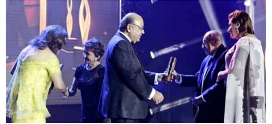
تسليم احدي الجوائز

اعتزاز كبير بقدرات وطاقت العرب في كل مجال وفي كل مكان. - المعنى الثالث: هو أن مبادرة «تكريم» تحمل أيضا نظرة واثقة في مستقبل الأمة العربية وكذلك سعي جاد لدينا جميعا بأن نحقق الافادة الكاملة، من العنصر البشري للامة، وأن نعمل جاهدين بكل جد وعزم لإتاحة الفرصة الكاملة أمام أبناء وبنات هذه الأمة للاسهام في تحقيق التقدم والتطور في بلدانهم، بل وأيضا القيام بدور مهم في سبيل تحقيق التقدم في العالم كله. - المعنى الرابع: هو أن اجتماعنا معا الليلة هو وسيلة مهمة لفتح