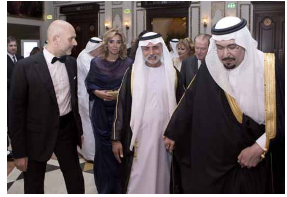
الامير منصور بن ناصر بن عبد العزيز وصاحب السمو الشيخ نهيان بن مبارك آل نهيان، وزير الثقافة والشباب وتنمية المجتمع في دولة الامارات يصلان الى الحفل ويبدو في استقبالهما مؤسس مبادرة «تكريم»، الاعلامي ريكاردو كرم

للسنة السادسة على التوالي، وكعادتها كل سنة، اطلقت مبادرة «تكريم» الضوء على مجموعة جديدة من المبدعين العرب في مجالات مختلفة، والذين أتت انجازاتهم غاية في التميز والابتكار. ١٣ مبدعة ومبدع عربي يشكل كل واحد منهم قصة نجاح باهرة تلهم الجيل الجديد، وتحاكي الهدف الذي ولدت مبادرة «تكريم» من اجله، كما رسمه مؤسسها الاعلامي ريكاردو كرم، الا وهو ابراز الوجه الحضاري للعرب ومدى قدرتهم على التفوق والابداع في مختلف المجالات، ودحض تلك الصورة السلبية التي لطالما الصقوها بنا، من ارهاب وتطرف وغيرها. وقد حياه على جهوده هذه، وزير الثقافة وتنمية المجتمع سمو الشيخ نهيان بن مبارك آل نهيان، الذي حدد اربعة معاني سامية لامستها مبادرة «تكريم».