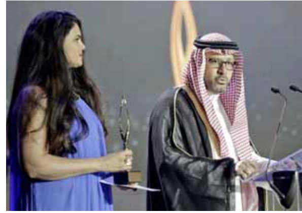
جائزة تنتظر صاحبها