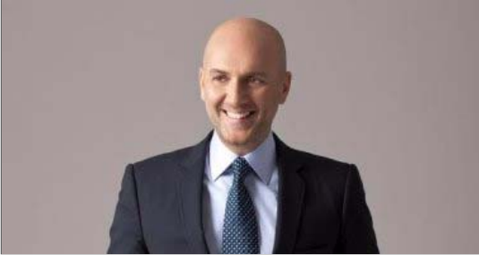
الإعلامى اللبنانى، ريكاردو كرم