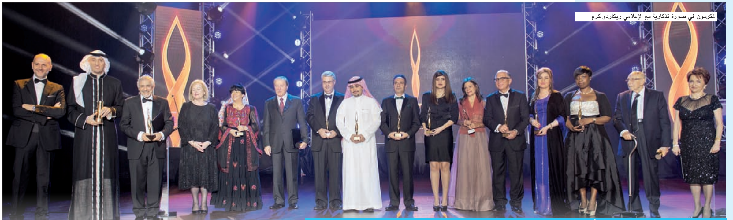
المكرمون في صورة تذكارية مع الإعلامي ريكاردو كرم

مبادرة يرهاها رجل الأعمال والإعلامي اللبناني ريكاردو كرم