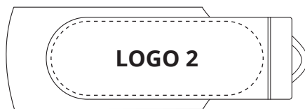
3D Color-Protect Vorderseite & Rückseite