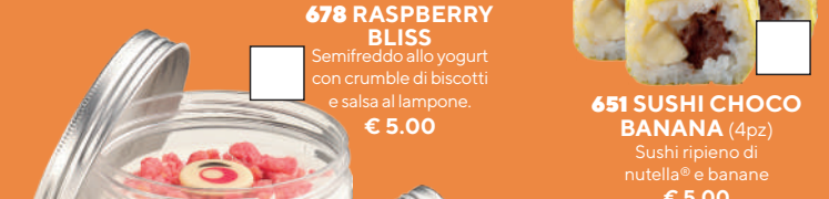
678 RASPBERRY BLISS Semifreddo allo yogurt con crumble di biscotti e salsa al lampone. € 5.00