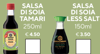
SALSA DI SOIA TAMARI 250ml € 4.50