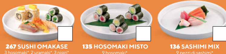
267 SUSHI OMAKASE 3 hosomaki*, 2 uramaki*, 3 nigiri* € 8.00