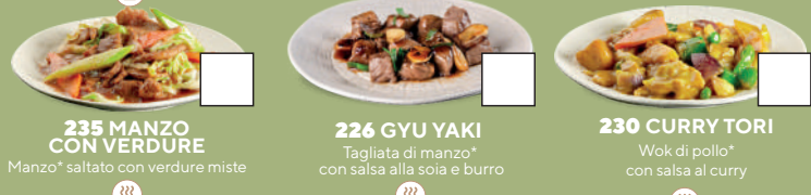
235 MANZO CON VERDURE Manzo* saltato con verdure miste