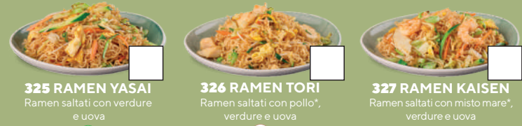
325 RAMEN YASAI Ramen saltati con verdure e uova