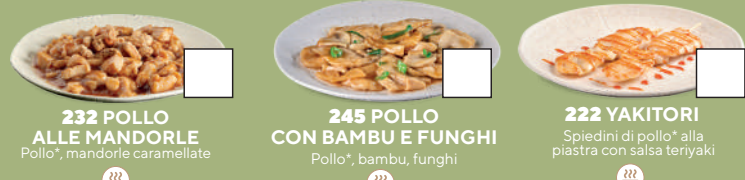
232 POLLO ALLE MANDORLE Pollo*, mandorle caramellate