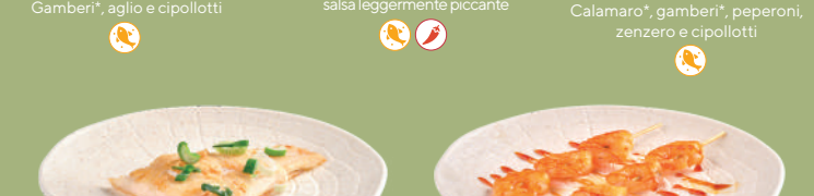
221 SHIROMI YAKI Pesce bianco* alla piastra, cipollotti