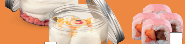
677 MANGO TANGO Semifreddo al mascarpone con crumble di biscotti e salsa al mango. € 5.00