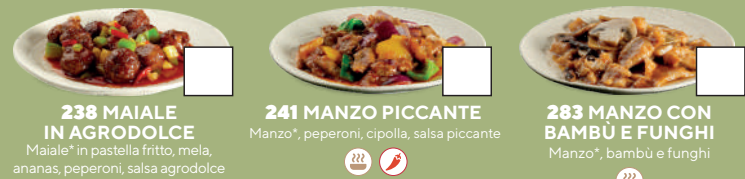
238 MAIALE IN AGRODOLCE Maiale* in pastella fritto, mela, ananas, peperoni, salsa agrodolce