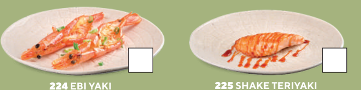
224 EBI YAKI Gamberoni* alla piastra