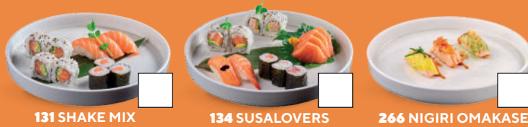
131 SHAKE MIX 3 hosomaki*, 4 uramaki*, 3 nigiri* € 8.00