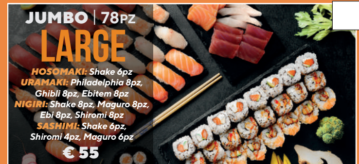
JUMBO | 78PZ LARGE HOSOMAKI: Shake 6pz URAMAKI: Philadelphia 8pz, Ghibli 8pz, Ebitem 8pz NIGIRI: Shake 8pz, Maguro 8pz, Ebi 8pz, Shiromi 8pz SASHIMI: Shake 6pz, Shiromi 4pz, Maguro 6pz € 55