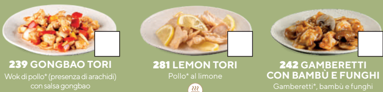
239 GONGBAO TORI Wok di pollo* (presenza di arachidi) con salsa gongbao leggermente piccante