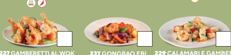
227 GAMBERETTI AL WOK SALE E PEPE Gamberi*, aglio e cipollotti