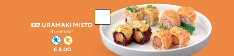
137 URAMAKI MISTO 8 uramaki* € 8.00