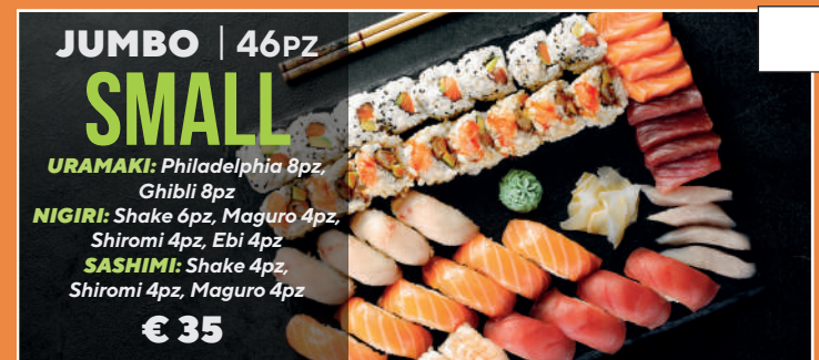
JUMBO | 46PZ SMALL URAMAKI: Philadelphia 8pz, Ghibli 8pz NIGIRI: Shake 6pz, Maguro 4pz, Shiromi 4pz, Ebi 4pz SASHIMI: Shake 4pz, Shiromi 4pz, Maguro 4pz € 35