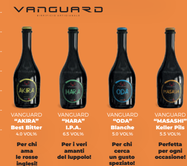
VANGUARD "AKIRA" Best Bitter 4.0 VOL% Per chi ama le rosse inglesi! VANGUARD "HARA" I.P.A. 6.5 VOL% Per i veri amanti del luppolo! VANGUARD "ODA" Bianche 5.5 VOL% Per chi cerca un gusto speziato! VANGUARD "MASASHI" Koller Plus 5.5 VOL% Perfetta per ogni occasione!