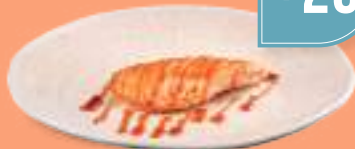
225 SHAKE TERIYAKI Salmone* alla piastra