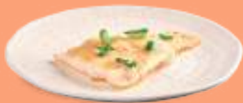
221 SHIROMI YAKI Pesce bianco* alla piastra, cipollotti