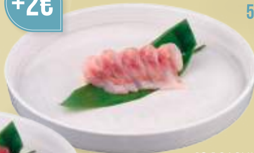
OGNI PORZIONE 5 PEZZI