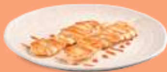
222 YAKITORI Spiedini di pollo* alla piastra con salsa teriyaki