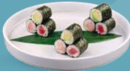
135 HOSOMAKI MISTO 9 hosomaki