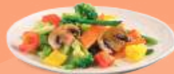
233 VERDURE MISTE Verdure miste saltate al wok