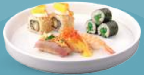
267 SUSHI OMAKASE 3 hosomaki, 2 uramaki, 3 nigiri