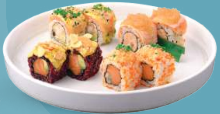
137 URAMAKI MISTO 8 uramaki