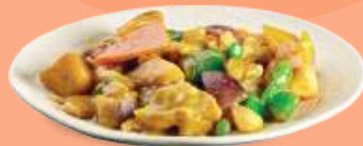
230 CURRY TORI