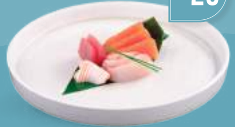
136 SASHIMI MIX 9 pezzi di sashimi