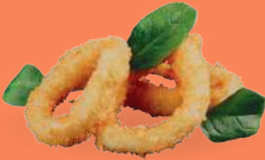
216 CALAMARI FRITTI Anelli di calamaro* fritti