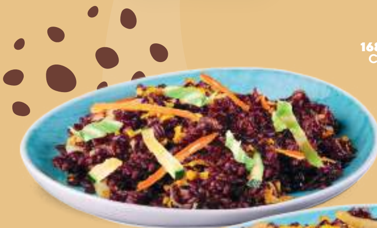
168 RISO VENERE CON VERDURE