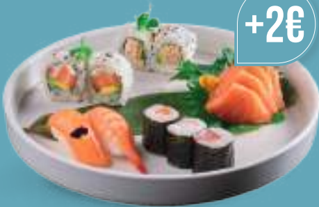
134 SUSALOVERS 3 hosomaki, 4 uramaki, 2 nigiri, 5 sashimi