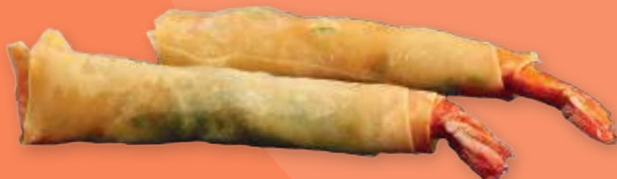
278 SAMURAI STICK (2pz) Involtini* di gamberi ed edamame