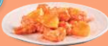
236 ORANGE EBI Gamberi* in pastella, ananas, salsa all'arancia, pistacchi