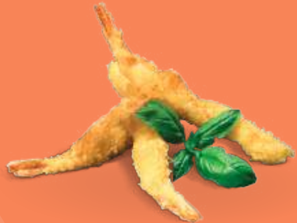
212 TEMPURA EBI Gamberoni* in tempura fritti