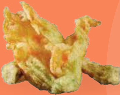
213 FIORI DI ZUCCA Fiori di zucca in tempura