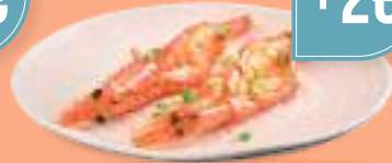
224 EBI YAKI Gamberoni* alla piastra