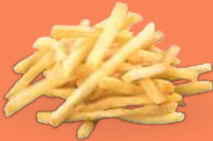
210 PATATE FRITTE Patate fritte*