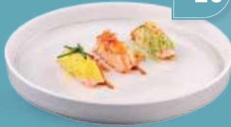
266 NIGIRI OMAKASE 3 nigiri special sushiko