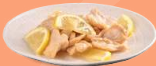
281 LEMON TORI Pollo* al limone