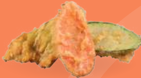
302 TEMPURA KAKIAGE Strisce di verdura fritte