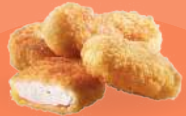
98 NUGGETS DI POLLO Nuggets* di pollo fritti