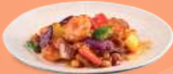
237 GONGBAO EBI Gamberi* con verdure , arachidi, salsa leggermente piccante