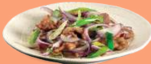
240 MANZO CON CIPOLLA E PEPE NERO

Manzo*, cipolla di tropea, pepe nero, cipollotti