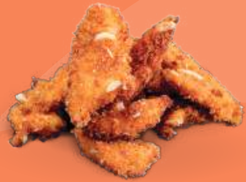
207 SPICY TORI Straccetti di pollo* fritto in crosta di mandorle e paprika