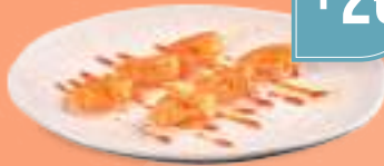
223 EBI KUSHI Spiedini di gamberi* alla piastra con salsa teriyaki