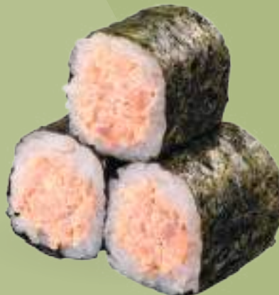
85 HOSOMAKI MIURA (3pz) Salmone* alla piastra