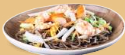
165 YAKI SOBA KAISEI Spaghetti di grano saraceno con misto mare* e uova