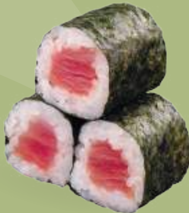
82 HOSOMAKI MAGURO (3pz) Tonno*