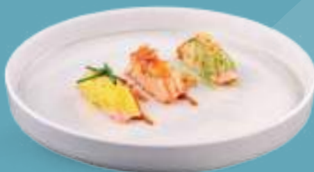
266 NIGIRI OMAKASE 3 nigiri special sushiko