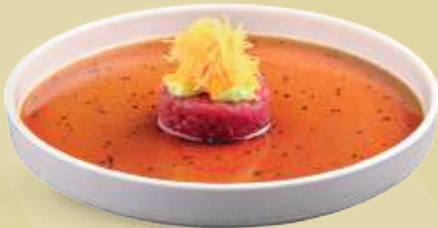
127 TARTARE MAGURO Tartare di tonno*, salsa ponzu dressing, guacamole, arancia, chips