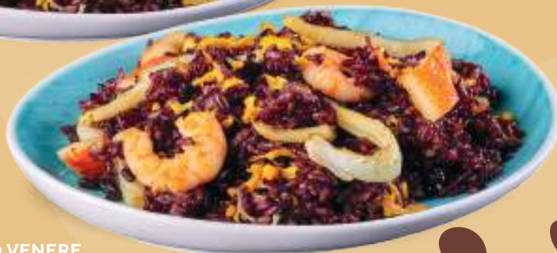
169 RISO VENERE CON MISTO MARE