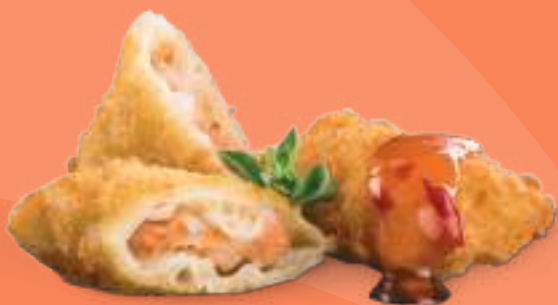
214 HARUMAKI EBI Involtini* giapponesi di gamberi