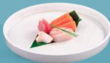
136 SASHIMI MIX 9 pezzi di sashimi