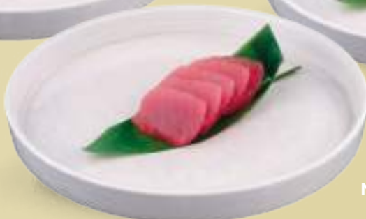
102 SASHIMI MAGURO (5pz) Tonno*