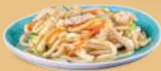
162 YAKI UDON TORI Noodles con pollo* e verdure