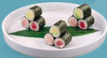
135 HOSOMAKI MISTO 9 hosomaki