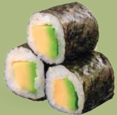
83 HOSOMAKI AVOCADO (3pz) Avocado