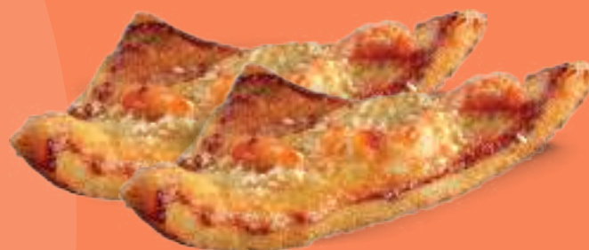
279 TOAST DI GAMBERI (2pz) Pollo macinato, gamberi, sesamo