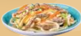
163 YAKI UDON GYU Noodles con manzo* e verdure leggermente piccante