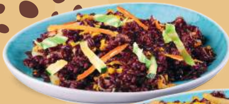
168 RISO VENERE CON VERDURE