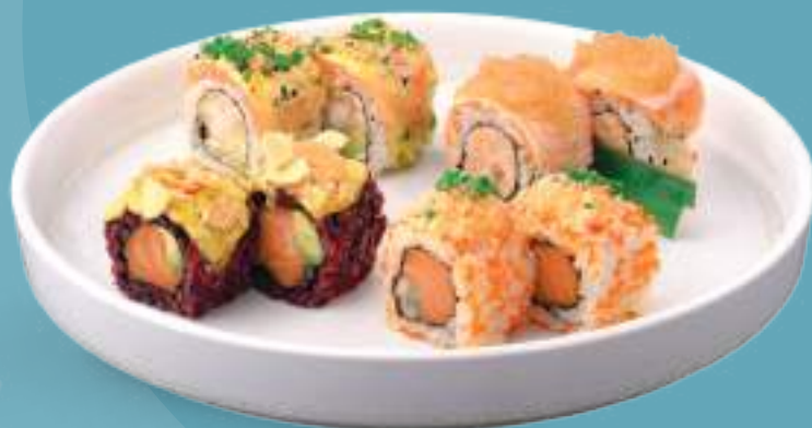
137 URAMAKI MISTO 8 uramaki