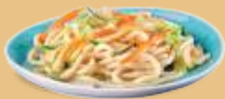
161 YAKI UDON YASAI Noodles con verdure