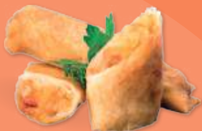
303 HARUMAKI YASAI Involtini di verdure