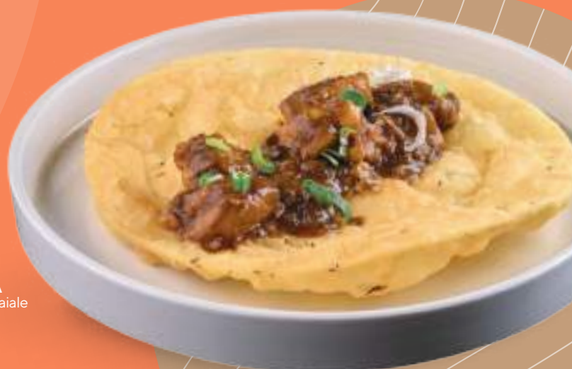
304 CONG YOU BING CON STUFATO DI PANCETTA Cong you bing con stufato di pancetta di maiale e méicài (verdura secca cinese)