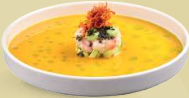
259 TARTARE SUZUKI Tartare di branzino*, salsa tropicale, guacamole, nori croccante, chips