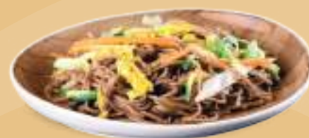
167 YAKI SOBA YASAI Spaghetti di grano saraceno con verdure e uova