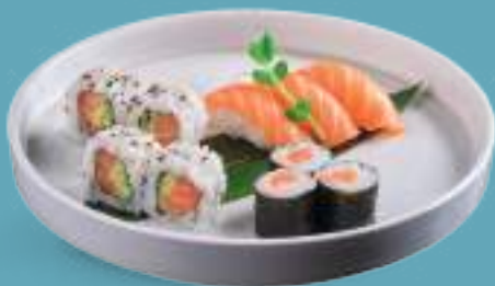
131 SHAKE MIX 3 hosomaki, 4 uramaki, 3 nigiri