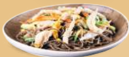
166 YAKI SOBA TORI Spaghetti di grano saraceno con pollo*, verdure e uova