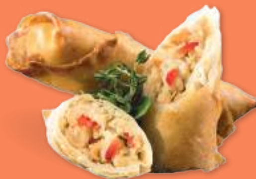
215 HARUMAKI TORI Involtini* giapponesi di pollo e verdure leggermente piccanti