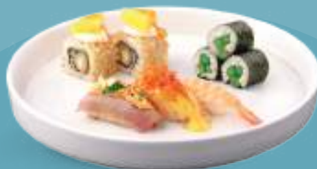
267 SUSHI OMAKASE 3 hosomaki, 2 uramaki, 3 nigiri