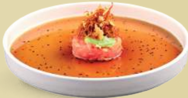
126 TARTARE SHAKE Tartare di salmone*, salsa ponzu dressing, guacamole, mandorle croccanti, chips