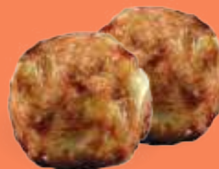
305 TAKOYAKI (2pz) Polpette di polpo fritte