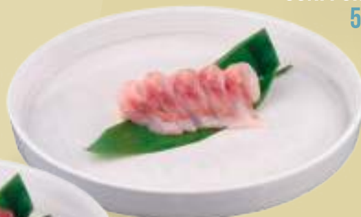
OGNI PORZIONE 5 PEZZI