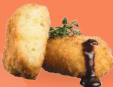
206 JAPAN KOROKKE Crocchette* giapponesi di patate e verdure, salsa teriyaki