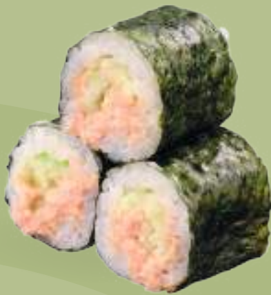
257 HOSOMAKI TUNA CETRIOLO (3pz) Tonno cotto*, cetriolo