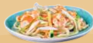
164 YAKI UDON KAISEI Noodles con misto mare*