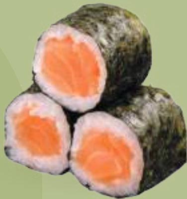
84 HOSOMAKI SHAKE (3pz) Salmone*