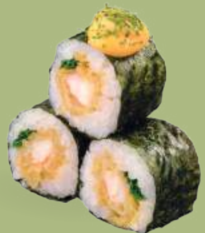
258 HOSOMAKI EBITEM NEGI (3pz) Gambero* in tempura, salsa teriyaki