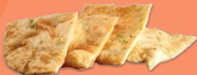
277 CONG YOU BING Focaccia cinese ai cipollotti