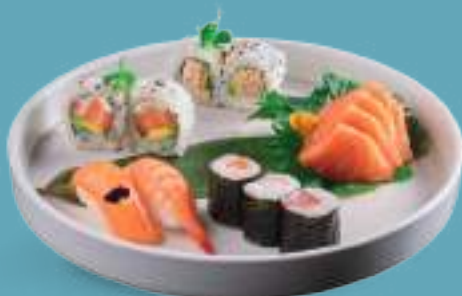
134 SUSALOVERS 3 hosomaki, 4 uramaki, 2 nigiri, 5 sashimi