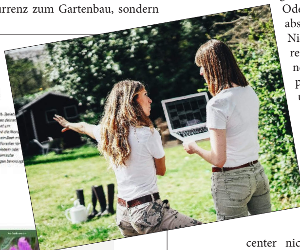
Den Traumgarten online planen und bestellen bietet „Green for me“.

Ziel ihres neues Pflanzenberaters ist es, für jeden Stil, Standort, jede Farbvor-