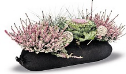
Wird einfach in den Blumenkasten gelegt: Pflanzennetz nach dem Blumixx-Prinzip.

moortorf, beim Abbau wird CO 2 freigesetzt und die Landschaft zerstört. Kokosrinde ist ein umweltfreundliches Abfallprodukt, sie ist leichter, kann mehr Wasser speichern und ist weniger anfällig gegen Schädlinge.“