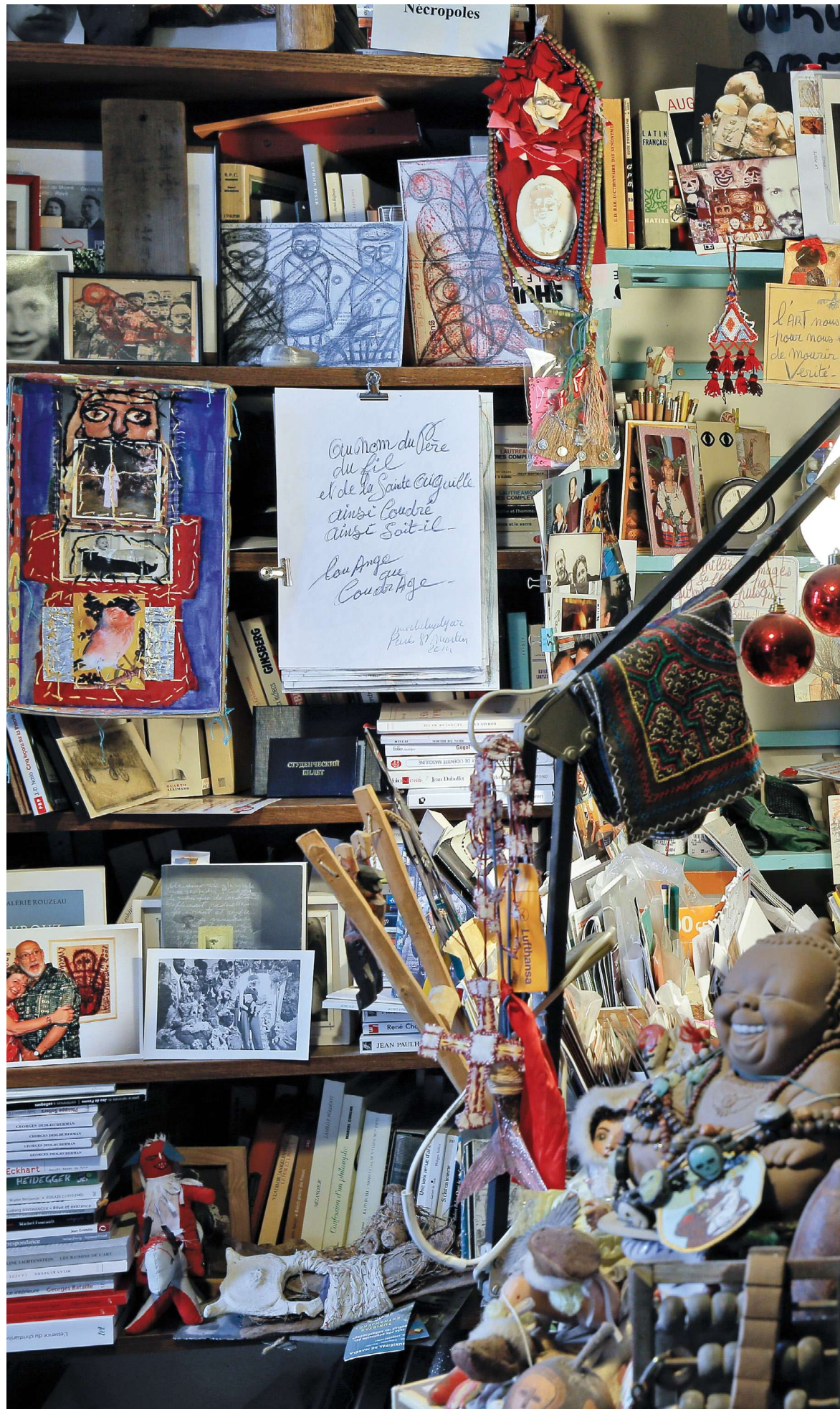
→ © Thierry Borredon, 2016