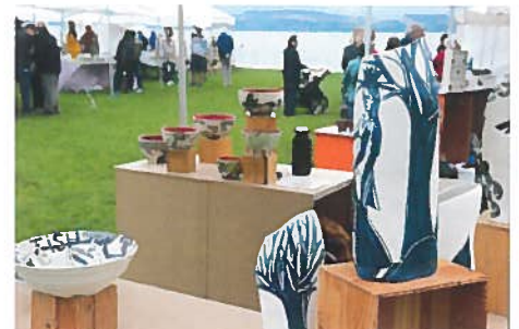
Une recherche esthétique orientée vers des mondes mythologiques dans ces travaux d'une céramiste vaudoise.