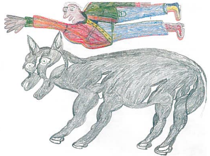
Manuel Lanca Bonifacio, «Gallopierende Pferd», s.d., crayon de couleur sur papier, 56 x 76 cm. Collection de l'Art brut, Lausanne.

Avec quelque deux mille accès dans les six dernières années, la Collection de l'Art brut à Lausanne fait preuve d'une belle vitalité. Pour la directrice de l'institution, Sarah Lombardi, le moment était venu d'organiser une exposition spécifique avec les nouvelles pièces, qui ont été acquises pour certaines mais pour la plupart reçues en donation depuis son entrée en fonction en 2012. Existant sous sa forme actuelle depuis 1976, la Collection de l'Art brut compte dans son