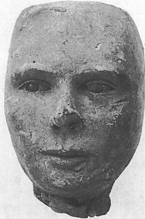
Photo: © Marie Hemaiz, Atelier de numérisation - Ville de Lausanne Collection de l'Art Brut, Lausanne, n° inv. cab-11078