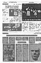
Emile Josome Hodinos - Homme, femme, enfant... - entre 1876 et 1896 crayon noir sur papier - 29,5 x 21 cm