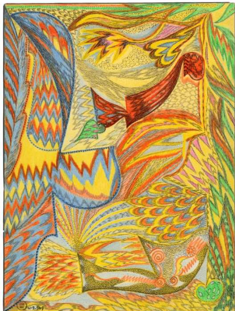
sans titre, 1964 encre de Chine et crayon de couleur sur papier, 32 x 24 cm Collection de l'Art Brut, Lausanne