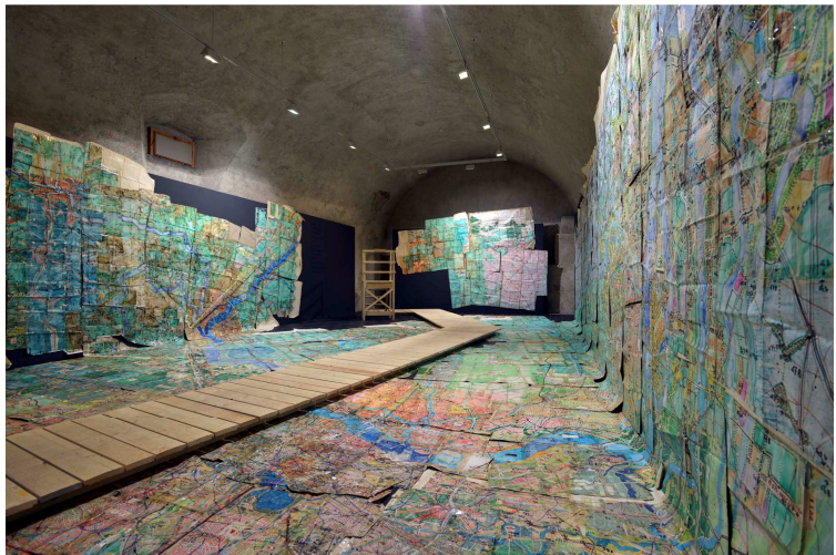
Vue de la carte du pays d'Athos , accrochage au Kunstmuseum Thurgau, Ittingen

Le monde imaginaire de Michael Golz, intitulé le pays d'Athos , est l'œuvre d'une vie. L'auteur allemand, né en 1957, y travaille depuis son enfance, à partir des années 1960. Cette production unique et monumentale est constituée de plusieurs éléments : une carte géographique, des dessins représentant des vues de lieux, villes et paysages du pays d'Athos , et des classeurs contenant des centaines de dessins et textes relatant les voyages de Michael Golz à travers ce pays fictif.